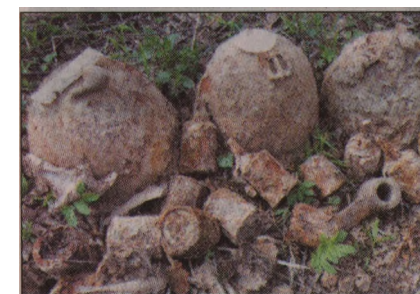
Вещи солдат (каска, гранаты, трубка, расческа).

Котласском краеведческом музее и котласском архиве хранится список переименованных улиц. Там есть и старые, и новые названия. Но список далеко не полный.