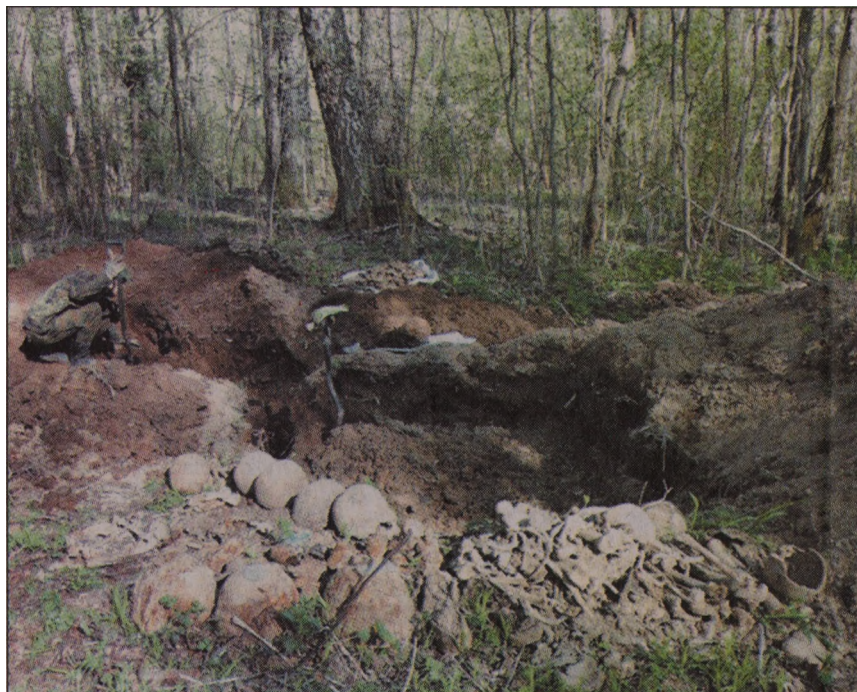
В этой яме найдены останки 16 советских солдат.