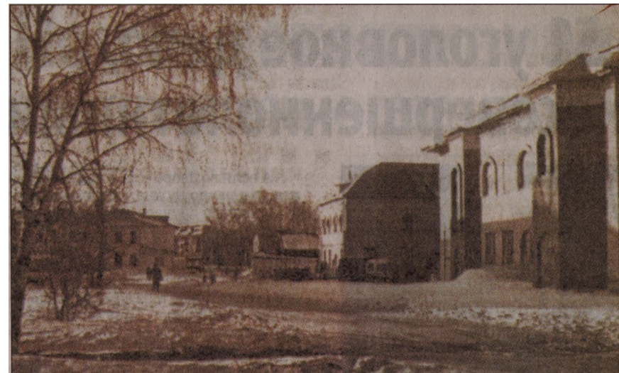
Переулок Ракитина в начале 21-го века.