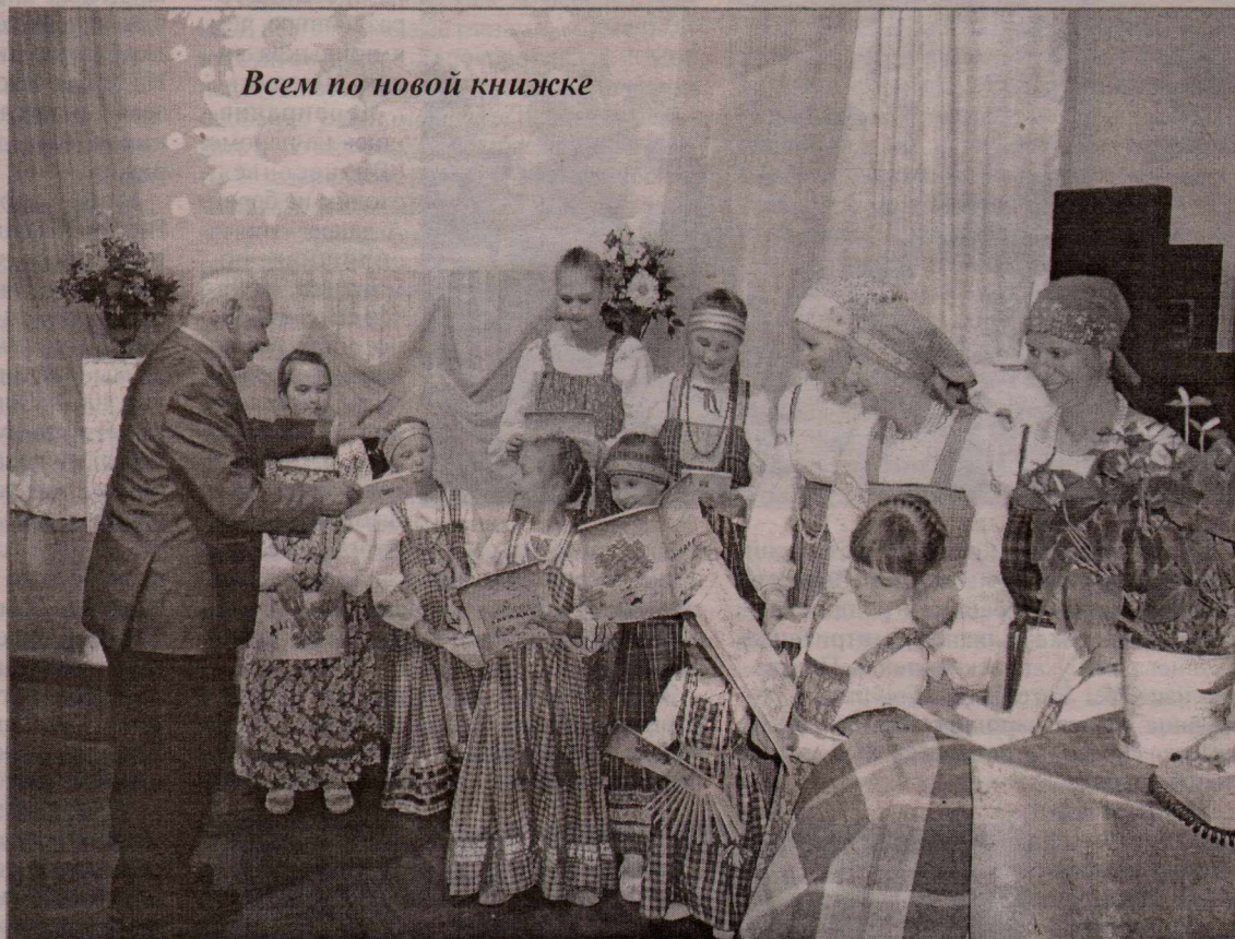
Всем по новой книжке