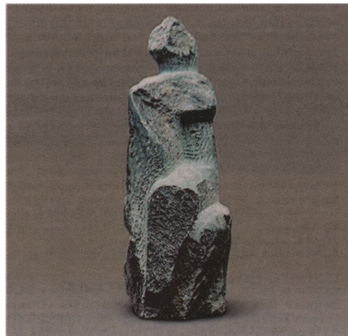
Две сидящие фигуры