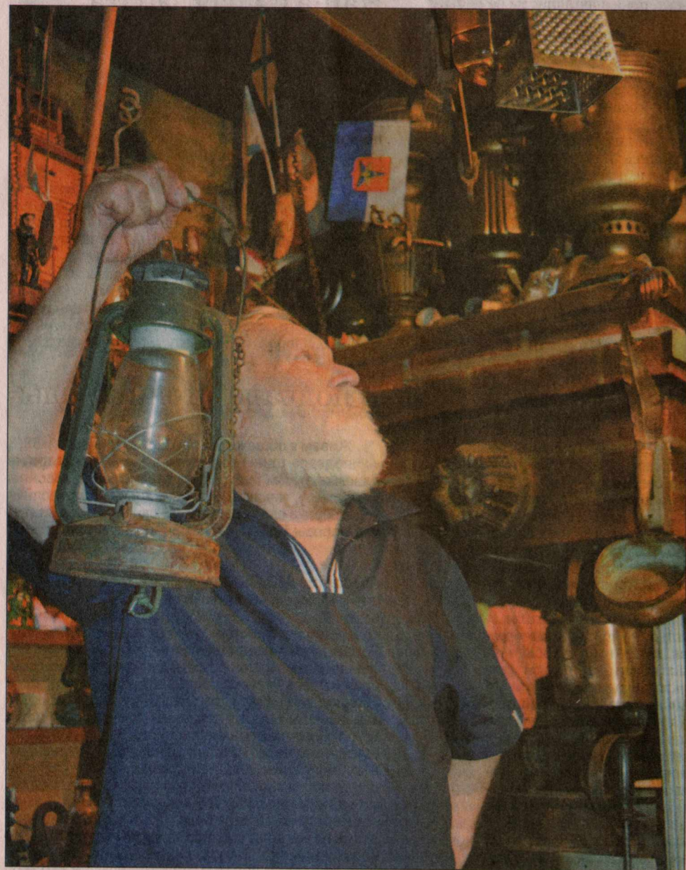
Его дом – его лаборатория.