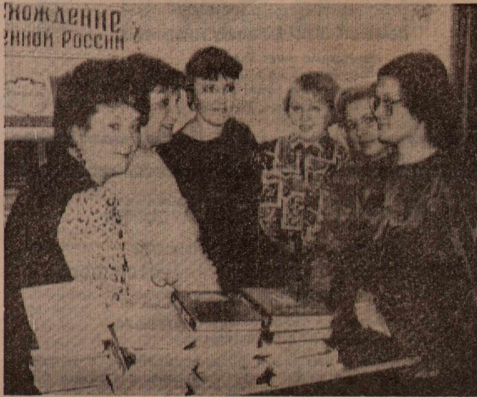
На снимке: работники городской библиотеки.

Библиотека обслуживала на дому больных и престарелых читателей. В этом ей помогали активисты. В 1941 году библиотека занимала две маленьких комнатки в старом здании горисполкома. Число читателей увеличилось за счет эвакуированных, но работать становилось все трудней. Книги не выпускались, журналы не выходили. Газета «Правда» приходила в Котлас через две недели после выпуска. Но библиотека продолжала работать. Были громкие читки патристических рассказов А. Толстого, К. Симонова. За активную