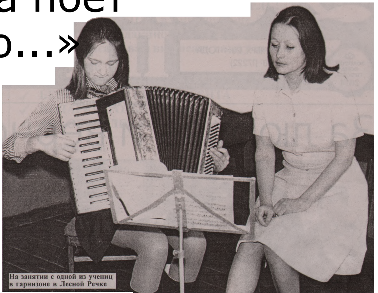
На занятии с одной из учениц в гарнизоне в Лесной Речке