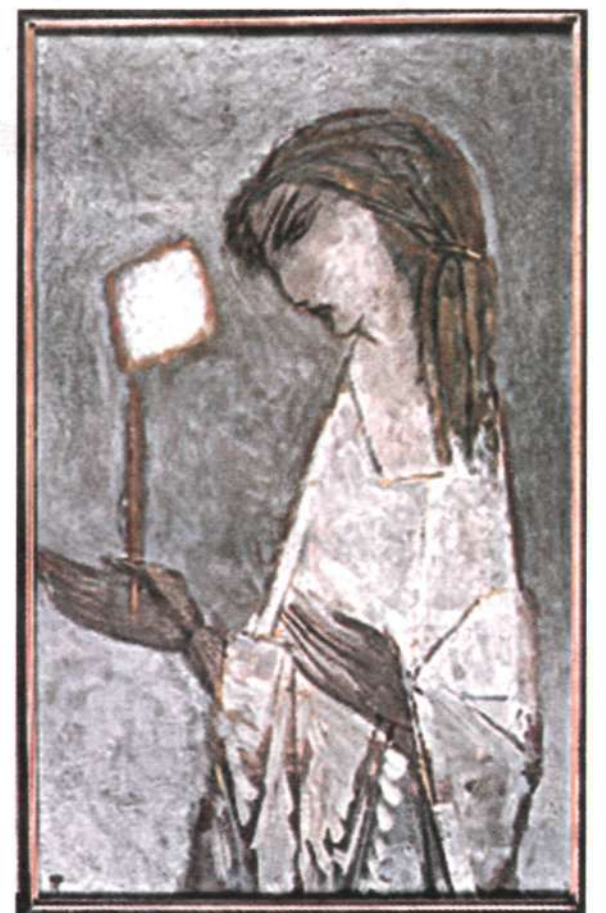
Ангел со свечой. 1991