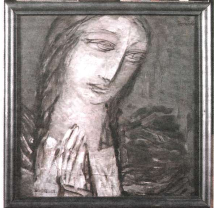
Ангел. Лик. 1990-е