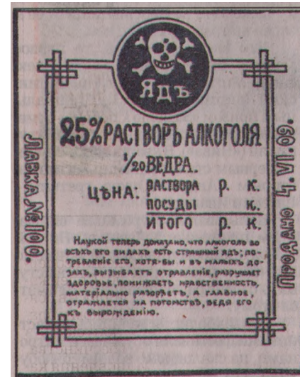
Так выглядела акцизная марка.

Фрагмент объяснительной записки внесенной в IV Госдуму законодательного предложения «Об утверждении на вечные времена в Российском государстве трезвости», 1914 год.