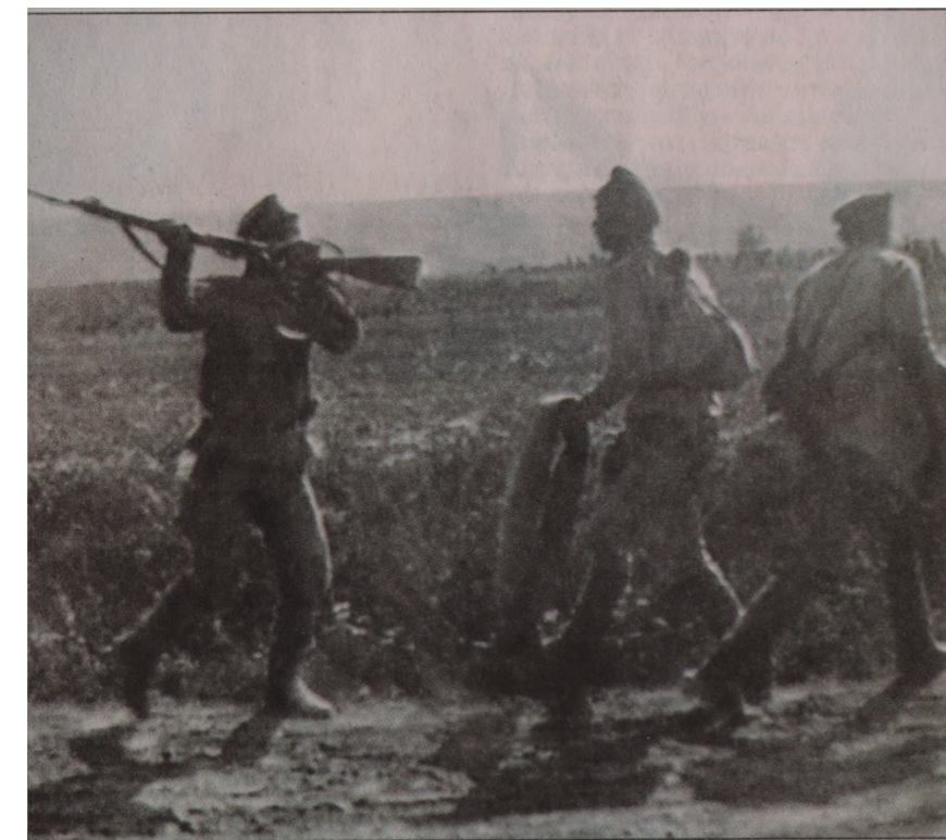
Русский солдат, верный присяге, прикладом пытается остановить своих однополчан-дезертиров. Лето 1917 года.