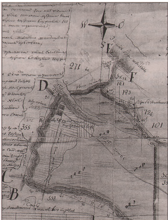
Графический план котласских владений барона Строганова. 1787 г.