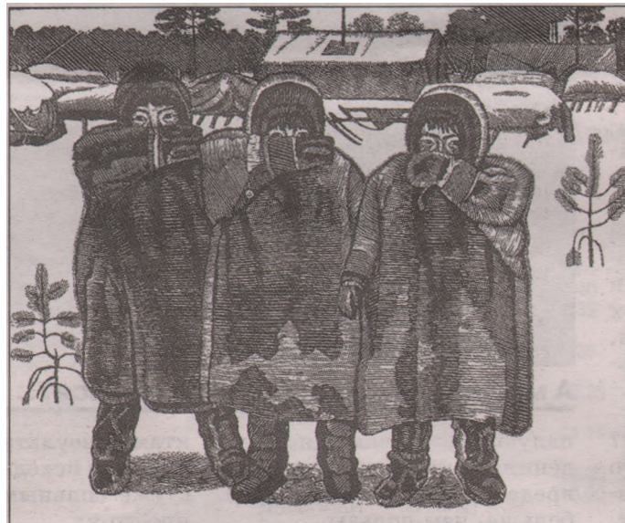
«Дети тундры», 1971