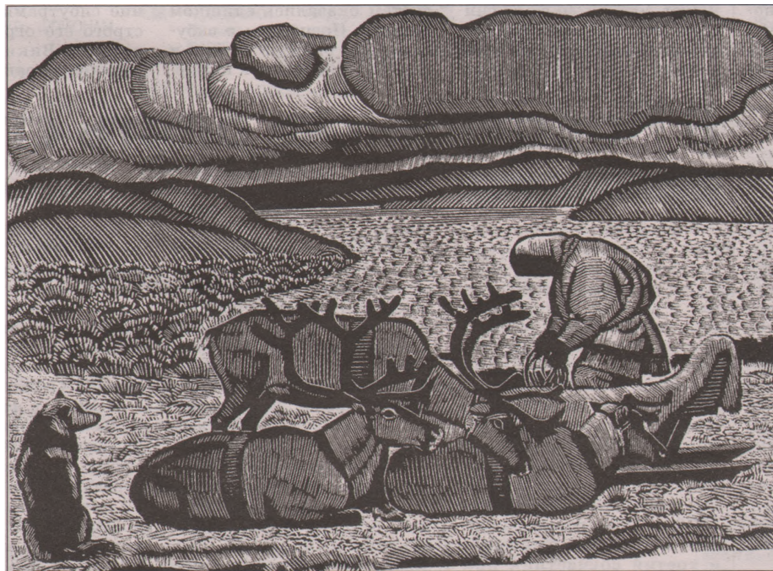
«Грозное небо», 1975