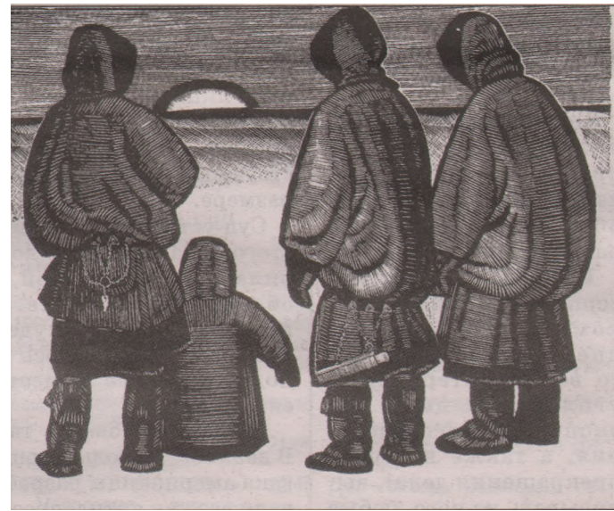
«Зимнее солнце», 1968