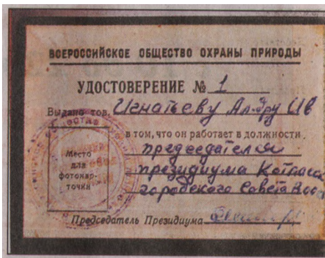
Удостоверение председателя президиума