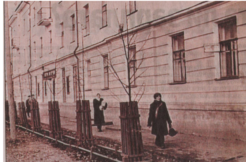
Озеленение улицы Ленина (здание книжного магазина) липой в 50-е годы.