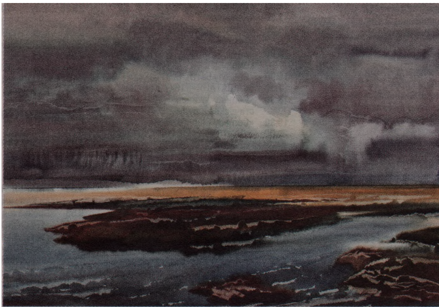
Гроза над морем