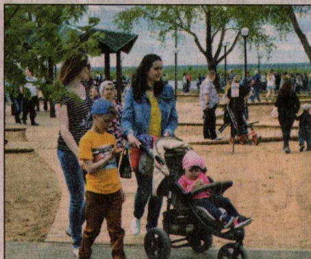
Власти Котласа надеются, что парк станет любимым местом отдыха горожан.