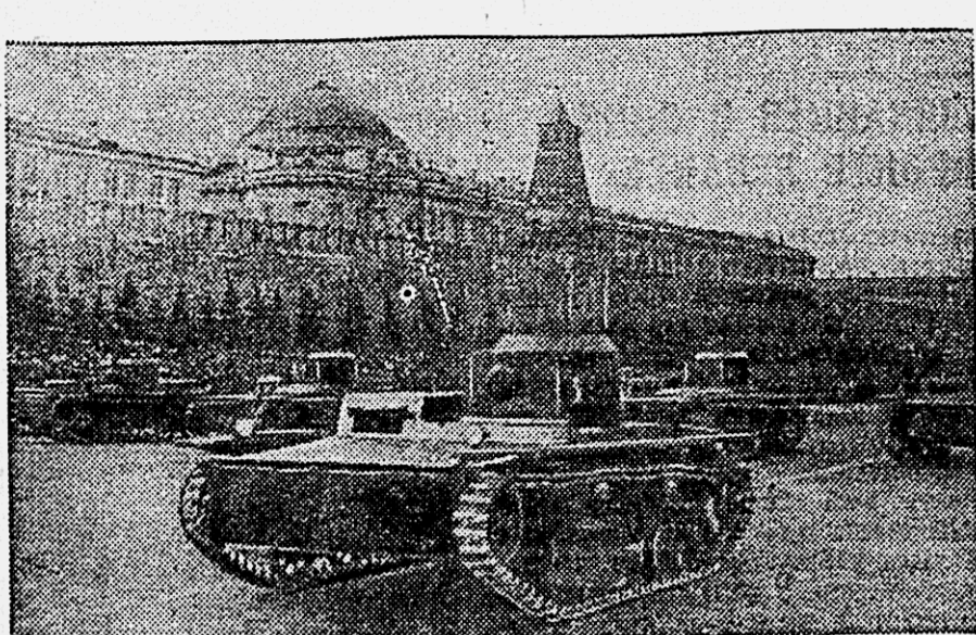
Празднование XXI годовщины Великой Октябрьской Социалистической революции в Москве 7-го ноября 1938 года. Парад войск на Красной площади. На снимке: танкетки проходят через Красную площадь.

Рудakov. Секретарь комитета первичной кооперативной организации ВЛКСМ. Пандома