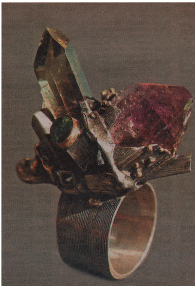
Одна из работ мастера