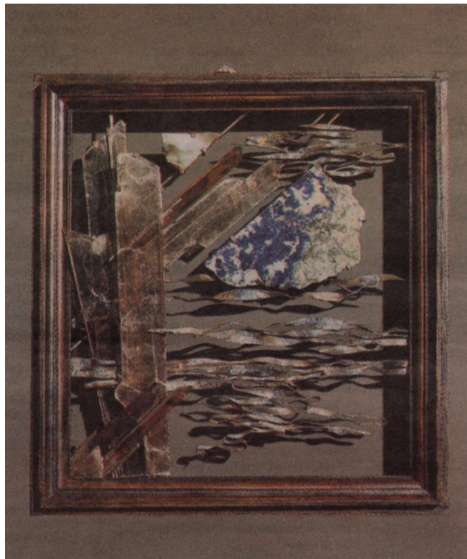
Декоративная композиция «Отражение», 2005