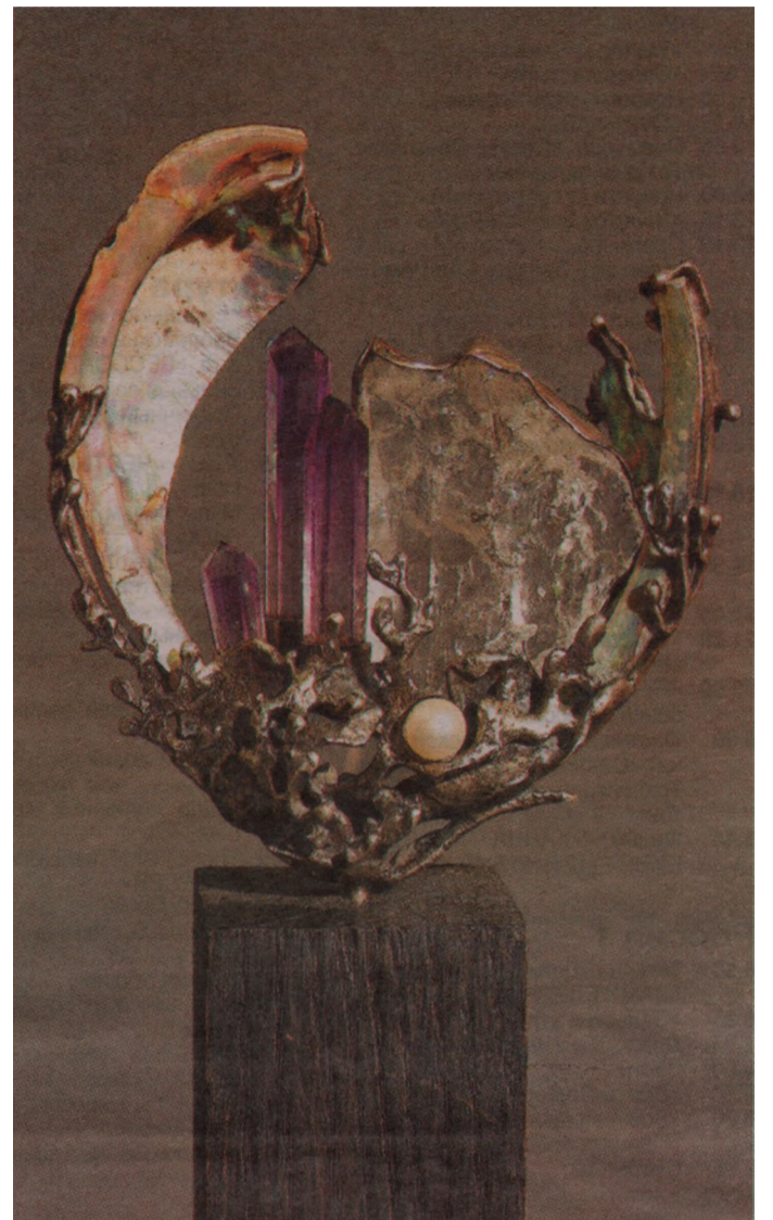
Декоративная композиция «Жемчужина», 2003