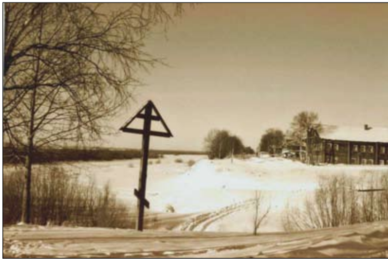
Уголок старой Мезени — бывшая Окладникова слобода. 2003 год

Процесс заселения Помезенья русскими к началу XVII века практически завершился. В это время князь Борис Мезецкий и подьячий Рахманин Воронов провели первую «перепись населения». Ее результаты отражены в писцовой книге за 1622–1623 годы по Кеврольскому стану. Тогда на Мезени, помимо Окладниковой и Кузнецовой слобод, существовало до 80 различных русских поселений, в которых проживало почти 1200 человек. В Окладниковой и Кузнецовой слободах уже числилось 110 дворов и более 2200 жителей 19 . Большинство деревень, слободок,