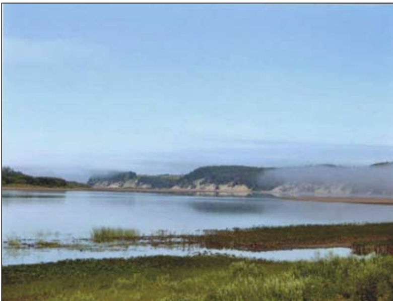
Мезенские просторы. 2001 год