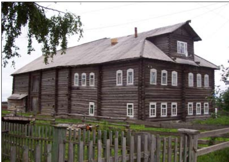
Лампожня, старый дом. Фотография А. С. Панкратова. 2008 год