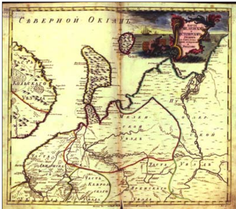
Карта Мезенского уезда из «Атласа Российской империи». СПб., 1747

родными местами, на которых возможно хлебопашество, являются только гористые возвышенности по р. Мезени, особенно в южной части уезда, как удаленные от болот и защищенные от северных ветров густыми лесами. Но и здесь холодный суровый климат вместе с ранними (осенью) и поздними (весною) заморозками очень часто не дают созреть посевам или убивают их совершенно.