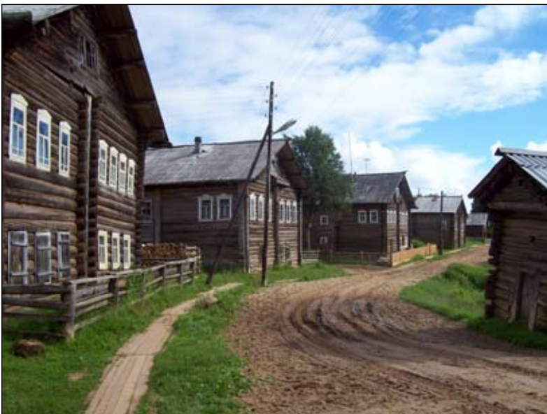
Деревня Кимжа. 2008 год

погостов, починков возникало на месте прежних селений и капищ покоренной чуди. Отсюда и необычность названий — Азаполье, Юрома, Мелосгора, Чиневара, Целегора, Кельчемгора, Кимжа... Как видим, для многих названий характерно окончание «гора». Это объясняется расположением поселений на обрывистых высоких берегах — «горах», являющихся типичными компонентами мезенских пейзажей. «На вершине обрыва нежно зеленеют свежие лиственницы. Если взглянуть с обрыва вниз — леса и леса, необозримые лесные пространства. Внизу извивается Мезень. Отсюда она кажется узенькой, голубой. <...> Иногда береговой лес внезапно разбегается в стороны и открываются луга, покатые холмы с полосатыми пашнями. На холмах — ветряные мельницы и группы раскиданных по откосам изб 20 . Немало названий кончается на «щелье» — Чулащелье, Ущелье, Палашелье, Белощелье, Долгощелье... Эти поселения возникали в низменностях между «горами», именуемых на Севере «щельями», «щелями».