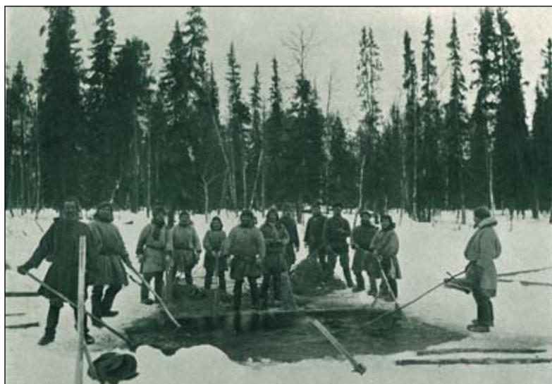
Последний лов рыбы в озерах Мезенского уезда. Из книги: Северный край. Иллюстрированный альбом...