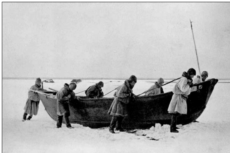
Мезенские промышленники тянут промысловую лодку к морю.