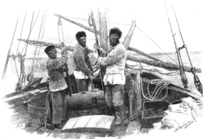
Фотографии начала XIX века. Из книги: Северный край. Иллюстрированный альбом Архангельской губернии (СПб., 1914)

Из книги: Случевский К. К. По северо-западу России. Т. 1. По северу России (СПб., 1886)