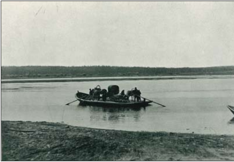
На реке Мезени

Фотографии начала XIX века.