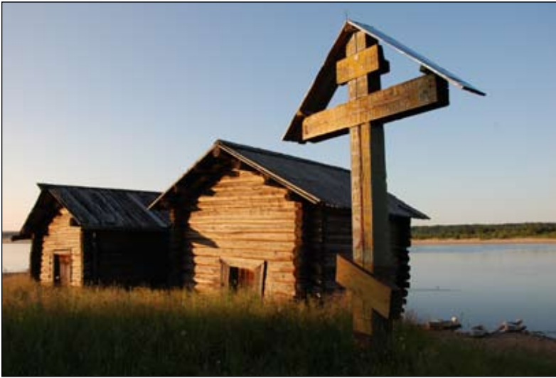
Деревня Азаполье. 2011 год