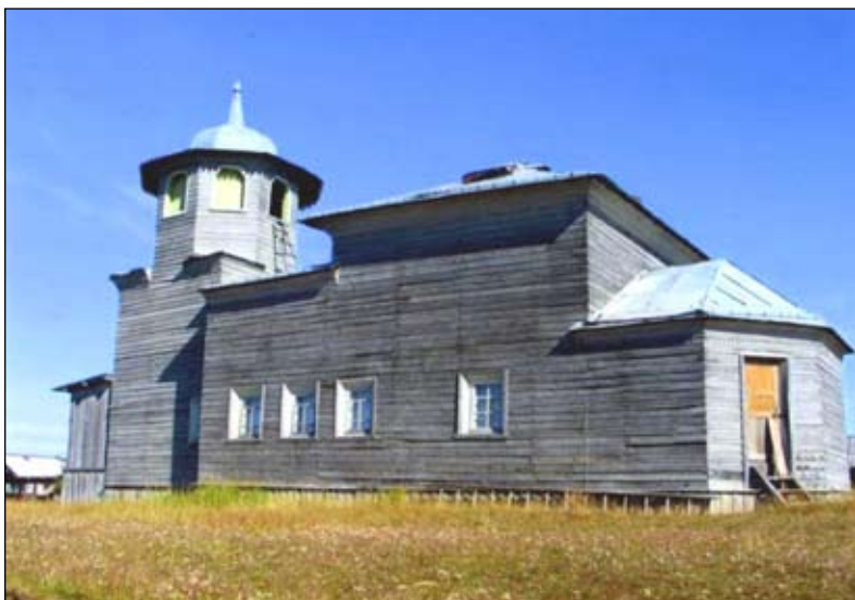
Церковь конца XIX века во имя Иоанна Крестителя в деревне Палащелье. Фотография автора. 2003 год