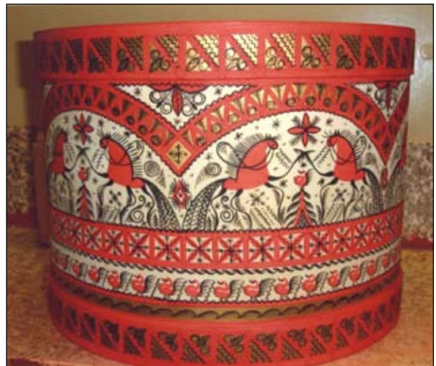
Старинные мотивы мезенской росписи на изделиях современных мастеров

Экспозиция Мезенского историко-краеведческого музея.