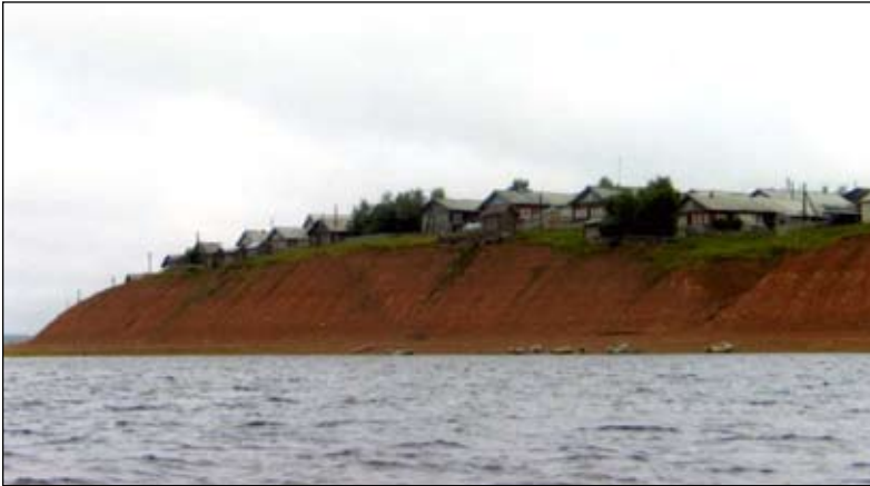
Деревня Целегора. 2001 год