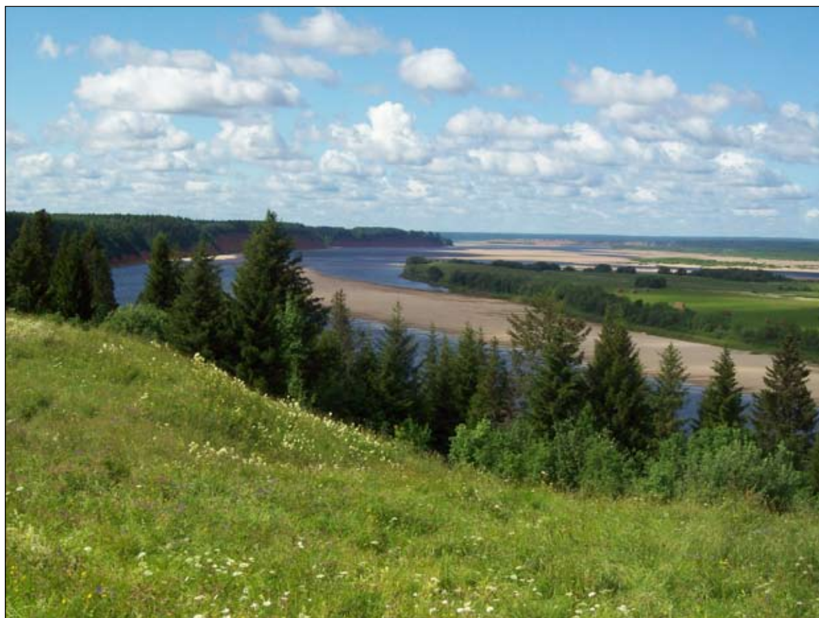
Стрелка Вашка — Мезень.