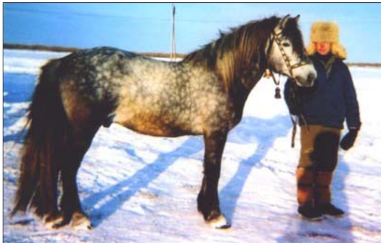
Мезенская порода лошадей. 2004 год

В 1691–1714 годах на Мезени и в Пинеге проживал сосланный Петром I бывший российский канцлер князь В. В. Голицин. Сюда он «получил из Москвы свой конский завод и бесплатно выдавал крестьянам <...> кровных кобыл для улучшения породы туземных лошадей. Говорят, что это обстоятельство было