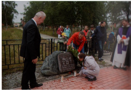
Памяти поляков — узников Соловков. Соотечественники