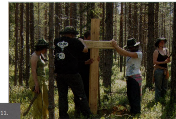
Pamięci zesłanych lat 1940-tych. 20†11. В память репрессированным