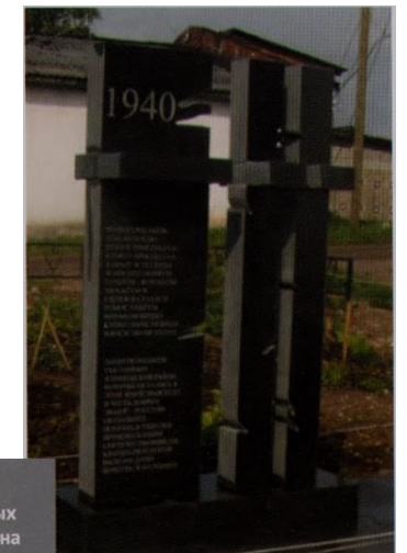
Памяти поляков, сосланных в Пинежский район, которые остались в этой земле навсегда. В честь добрых людей — россиян, оказавших помощь в тяжелые времена нашим соотечественникам, благодаря которой было им дано вернуться на родину