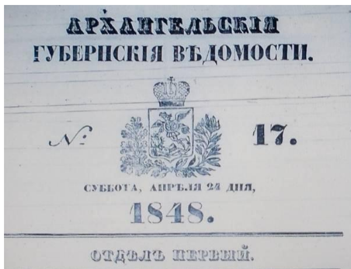
Фрагмент первой страницы газеты "Архангельские губернские ведомости" за 24 апреля 1848 года

Но вскоре был вынужден вернуться на родину - 11 ноября 1830 года после очередного