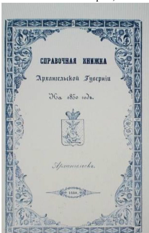
Справочная книжка Архангельской губернии на 1850 год