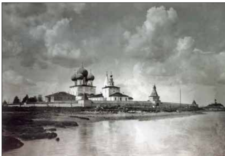
Николаевский Корельский монастырь.

Но «недолго посадница Марфа Борецкая оставалась покровительницей монастыря. Смутные события новгородской жизни дали повод Великому князю Иоанну III вмешаться в новгородские дела и подчинить Новгород своей власти» 21 . Однако ми-