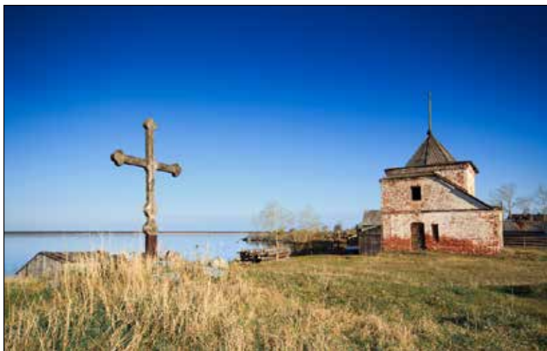
Территория Пертоминского монастыря сегодня.