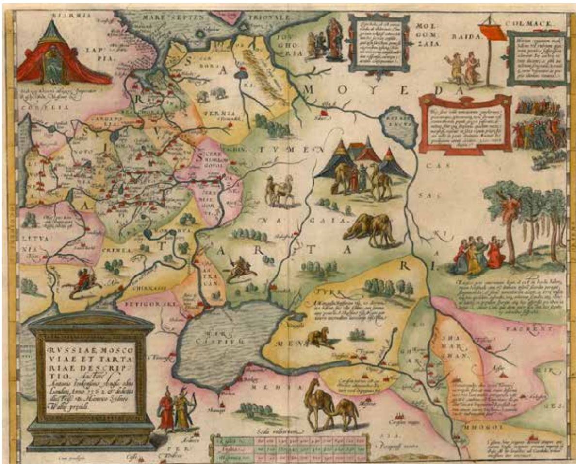
Карта Антония Дженкинсона. 1562 год

О Летнем берегу Беломорья (историко-краеведческий очерк)