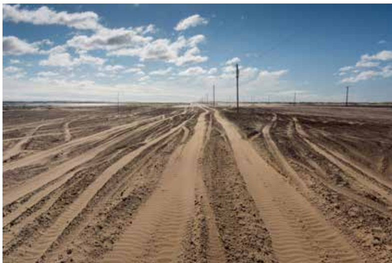
«Дороги» беломорского побережья.