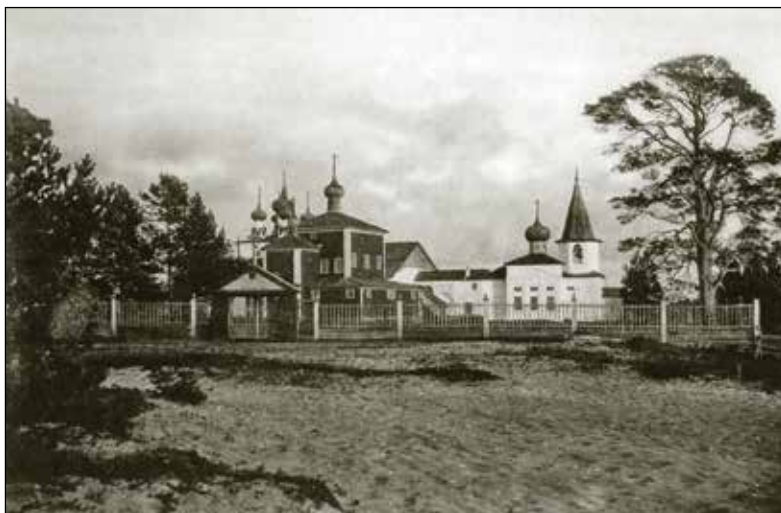
Пертоминский монастырь. Фотография 1886 года

Унская губа «славится обильным ловом зимой в прорубях крупной наваги. <...> Поднявшись на Красногорский рог, путник видит перед