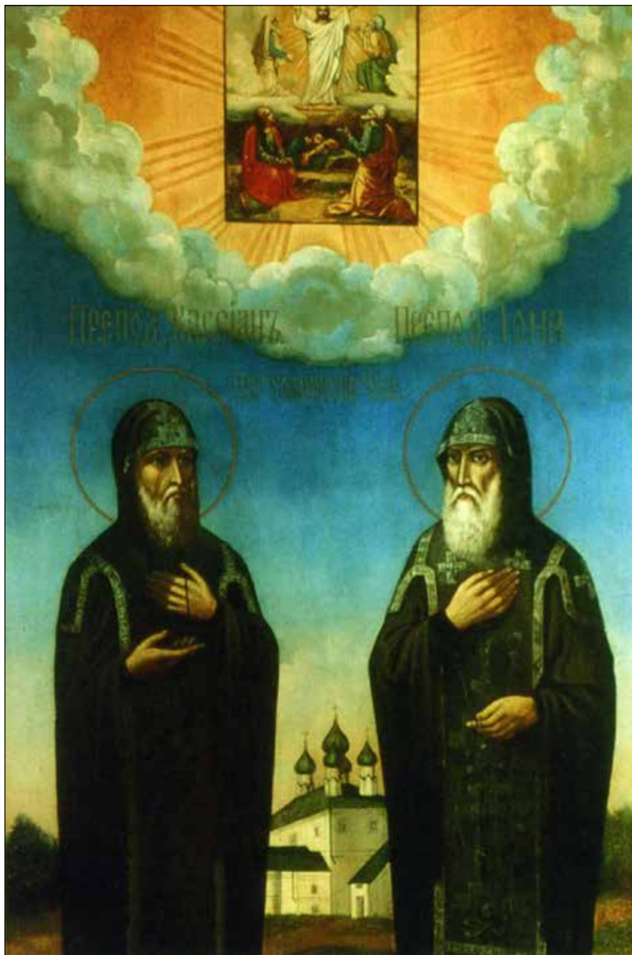
Преподобные Вассиан и Иона Пертоминские. Икона второй половины XIX века. Архангельский музей изобразительных искусств