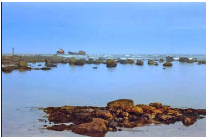
Умыса Летний Наволок.

или Жегжизня 65 , как будто весь затянутый в туман, обитаемый только служителями при маяке, освещаемом с 1842 года» 66 .