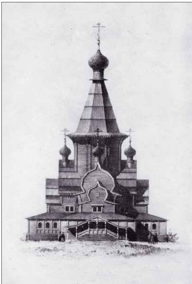
Церковь священномученика Климента в посаде Уна. Реконструкция западного фасада. Рисунок В.В. Сулова