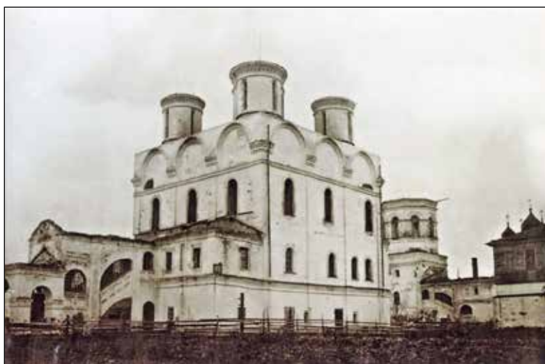
Соборный храм Никольско-Корельского монастыря в начале 1930-х годов