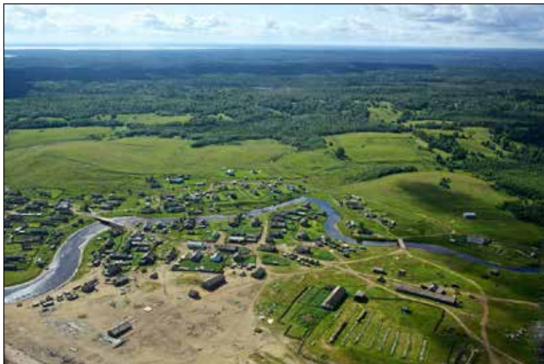
Деревни Яренга (Яреньга), Лопшеньга.

В 1635 году погост передали Соловецкому монастырю «со всем строением и с живущими в оном же оброчными, бобыльскими и казачьими людьми с дворами и со всеми угодьями. Погост этот стал известен особенно после явления почивающих в нынешнем Зосимо-Савватиевском Яренгском приходском храме мощей св. Иоанна и Логгина, бывших послушниками Соловецкого монастыря, <...> утонувших 1561–1563 гг. вместе с другими труженниками Соловецкими, плывущими на 15 судах с известью. <...> Найденные вскоре после потопления [их тела] были преданы земле — Иоанна на берегу р. Сярты в 7 верст. на запад от Яренги <...> и Логгина на берегу р. Сосновки в 8 верст. на восток от Яренги. <...> Затем спустя 25 лет честные мощи угодников Божиих по особым чудесным указаниям были перенесены к храму свят. Николая и положены — св. Иоанна под южной и св. Логгина под северной стеной часовни, нарочито перед этим построенной в честь угодников. <...> Яренгский погост, или монастырь, обращен в приходскую церковь, вероятно, во время повсеместного распоряжения правительства об отбирании