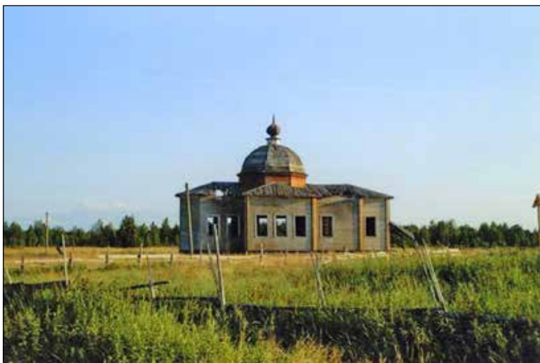
Уна. Климентовская церковь сегодня.