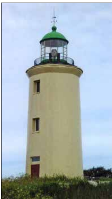
Действующий маяк на острове Жижгин

«С каменистого мыса Ухт-Наволока виднелся в дали моря по направлению к северо-востоку остров Жожгин,