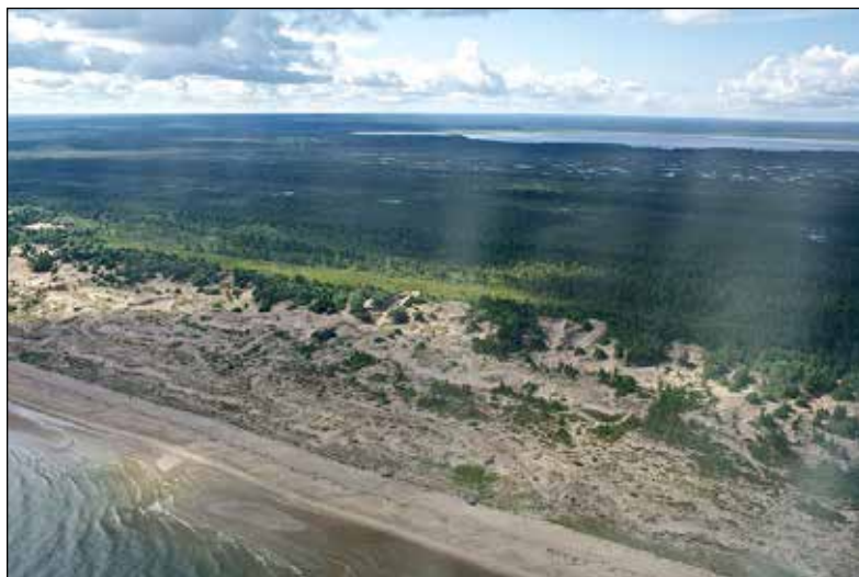
Участок Летнего берега Онежского залива.

Полуостров делит южную область Белого моря на два крупных залива — Двинский и Онежский. Восточный район Южного Поморья — предустьевая часть Северной Двины — является своеобразными морскими воротами всего Русского Севера. Здесь же пролегают и два исторических пограничных рубежа, напоминающих о противостоянии