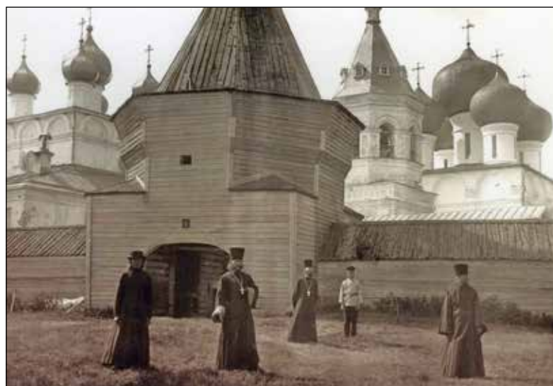
Фотографии начала XX века