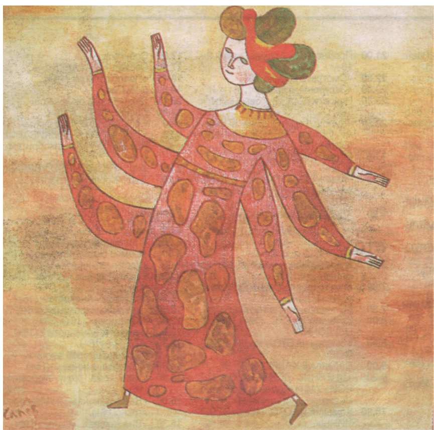
Исполняющая желания, 2012