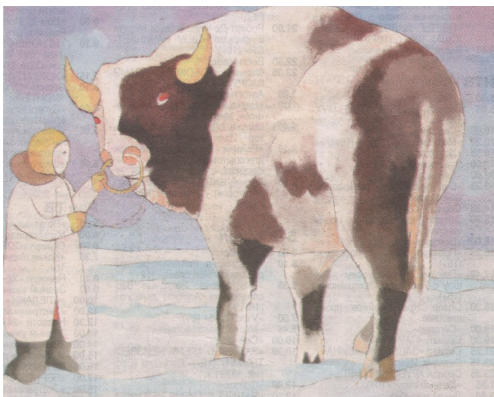
Девочка и бык, 2011