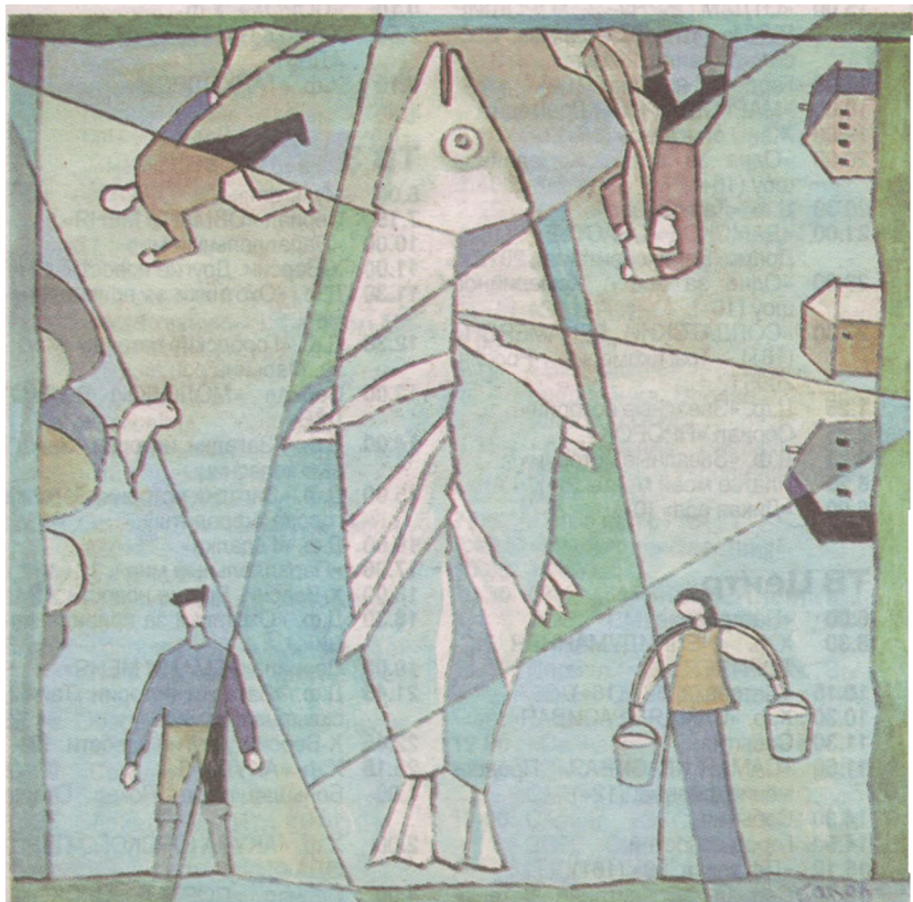
Поморская рыба, 2011