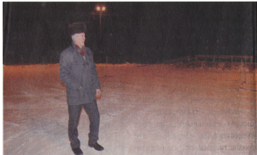
На пришкольной площадке

У выпускников школы есть прекрасная возможность получить водительские права уже в школе, что дает им конкурентное преимущество перед другими выпускниками. Особенно это актуально для парней, которые при выходе из школы могут работать водителями.