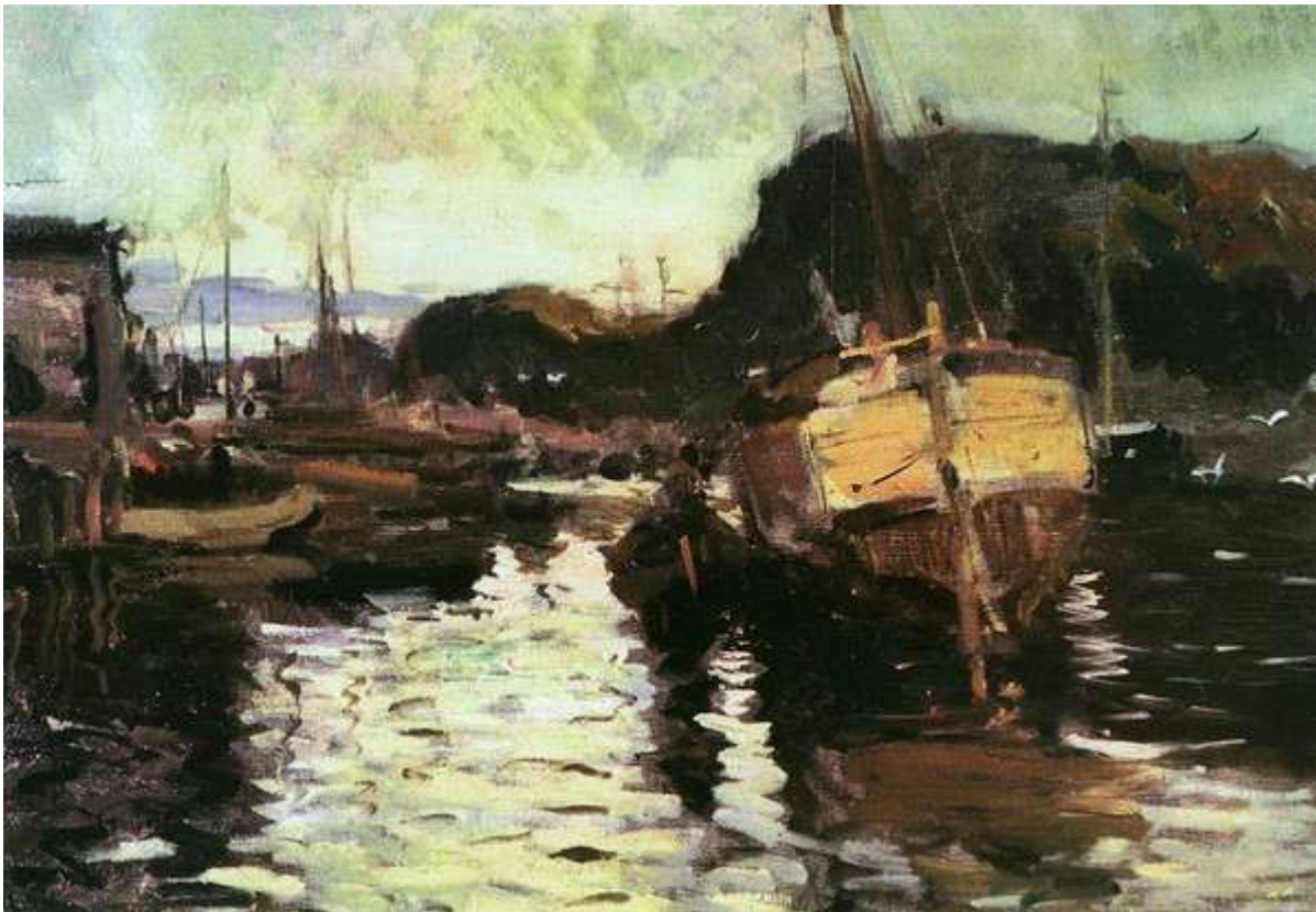
К.Коровин “На севере”

Следующий пункт путешествия художника лежит несколько западнее. Это – мыс Святой Нос, где на выходе из Белого в Баренцево море стоит один из старейших в России маяков. Его видно с моря. И этот вид с моря Святоносского маяка художник отобразил на этюде « Святой Нос » (1894). А вот что художник напишет позже: «Слева идут полосы низких скал, которые оканчиваются маленькой одинокой часовенкой, освещенной сбоку проглянувшимся полночным солнцем. Так бедно и глухо и безотрадно кругом, а эта светящаяся часовенка как бы подает надежду. Это и есть Святой Нос»[11]. К западу от Святого Носа расположен залив с тремя островами, два из которых уже имели название – Медвежий и Сальный, а третий был безымянным. Свое название он получил в 1894 г. во время поездки С.Ю.Витте с большой группой предпринимателей и деятелей искусств по Русскому Северу. Безымянный остров был назван в честь премьер-министра России островом Витте. И его посетил Коровин, о чем мы узнаем ознакомившись с этюдом « Остров Витте » (1894). Здесь же написан и этюд « Полночное солнце на Мурмане » (1894).