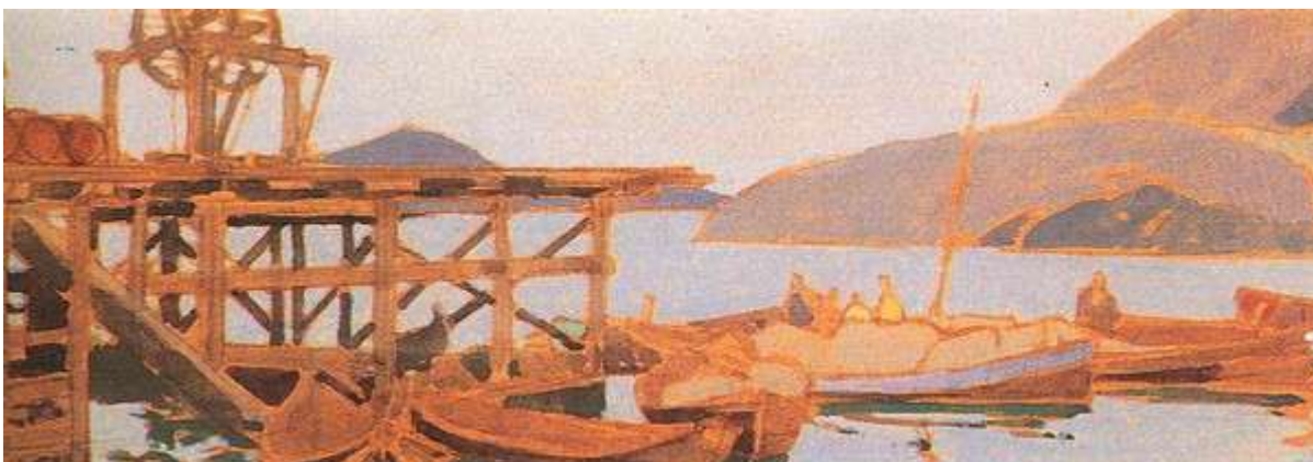
К.Коровин “Пристань у фактории на Мурмане”

Следующий пункт путешествия художника лежит несколько западнее. Это – мыс Святой Нос, где на выходе из Белого в Баренцево море стоит один из старейших в России маяков. Его видно с моря. И этот вид с моря Святоносского маяка художник отобразил на этюде « Святой Нос » (1894). А вот что художник напишет позже: «Слева идут полосы низких скал, которые оканчиваются маленькой одинокой часовенкой, освещенной сбоку проглянувшимся полночным солнцем. Так бедно и глухо и безотрадно кругом, а эта светящаяся часовенка как бы подает надежду. Это и есть Святой Нос»[11]. К западу от Святого Носа расположен залив с тремя островами, два из которых уже имели название – Медвежий и Сальный, а третий был безымянным. Свое название он получил в 1894 г. во время поездки С.Ю.Витте с большой группой предпринимателей и деятелей искусств по Русскому Северу. Безымянный остров был назван в честь премьер-министра России островом Витте. И его посетил Коровин, о чем мы узнаем ознакомившись с этюдом « Остров Витте » (1894). Здесь же написан и этюд « Полночное солнце на Мурмане » (1894).