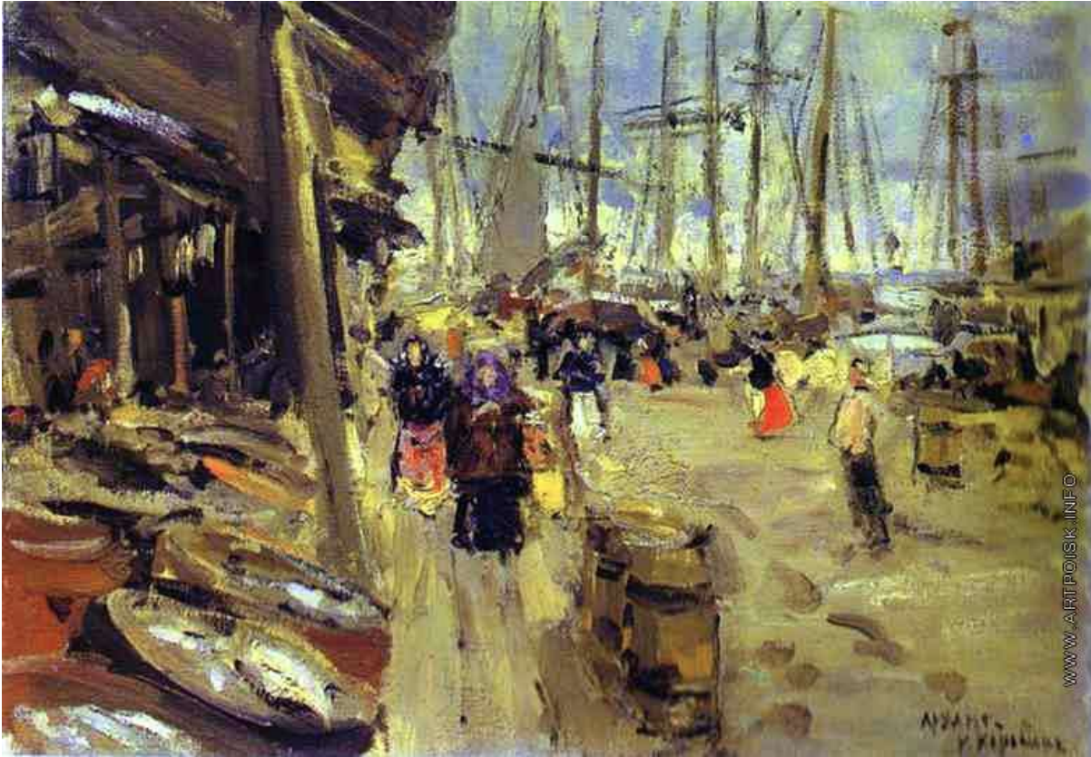
К.Коровин “Рыбная пристань в Архангельске”