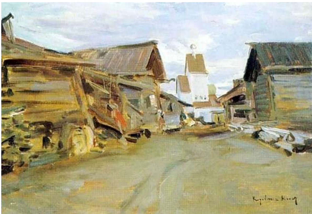
К.Коровин “Село на севере России”

замечательная. Много куполов, покрыты дранью, как рыбьей чешуей. Размеры церкви гениальны. Она – видение красоты. По бокам церковь украшена белым, желтым и зеленым, точно кантом. Как она подходит к окружающей природе !»[8].