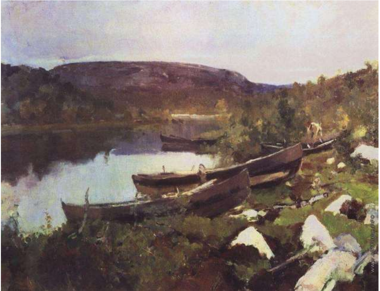
К.Коровин «Ручей святого Трифона в Печенге»

Коровин знакомится с местными легендами. С большой охотой он передавал услышанную им на севере Кольского полуострова, у Печенги, легенду о трагической гибели братии монастыря Святого Трифона и о небесной каре, постигшей ее виновников. Но ни в одной работе эта легенда не нашла отражение, хотя Константин Алексеевич посетил Печенгский монастырь имени Святого Трифона, исходил его живописные окрестности и написал здесь ряд этюдов, которые датируются 1894 г., – « Сентябрь в Печенге », « На Дальнем Севере », « Зима в Лапландии », « Ручей св.Трифона », « Водопад св.Трифона », « Норвежский домик на Печенге ». Одно из лучших произведений северного цикла Коровина, несмотря на его миниатюрные размеры, этюд « Зима в Лапландии ». На полотне изображены две старые крестьянские избы и сарай, затерявшиеся на необъятных просторах и стоящие среди сугробов снега на берегу замерзшей реки, под мглистым, серым небом. Предельной скудости и суровости природы соответствует предельная скупость изобразительных средств – строгость и простота композиционного построения, скупая, суровая стальная цветовая гамма. «Удивительно развито < > чувство колорита, далекого от всякой красочности и еще более от черноты, – писал об этом пейзаже С.Глаголь. – Прочувствован тон снега и так тонко и гармонично передан общий колорит»[14].