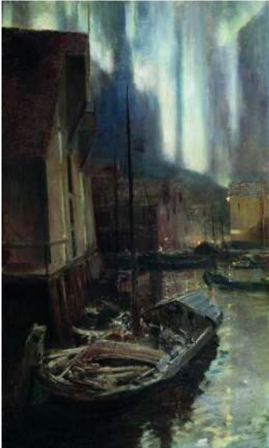
К.Коровин «Гаммерфест. Северное сияние»

Дальнейший маршрут Коровина и Серова лежит в Норвегию и Швецию. На пароходе они огибают крайнюю северную точку Европы – мыс Нордкап, трехсотметровую скалу, обрывающуюся в северное море. И у Константина Алексеевича рождается этюд «Нордкап» (1894). На пути новый пункт северного маршрута художника – норвежский город Гаммерфест. Это – центр зверобойного промысла на севере Европы, откуда норвежские промышленники ходили за морским зверем на Шпицберген, к Земле Франца-Иосифа, на Новую Землю и в Карское море. Попав сюда в начале северной осени, художник запечатлел обычное для этих широт явление – северное сияние. Так появился этюд «Гаммерфест. Северное сияние» (1894-1895). Пробыв в этом небольшом городке норвежских шкиперов и зверобоев несколько дней, Коровин написал еще ряд этюдов, среди которых «Белая ночь в Северной Норвегии» и «Гавань в Норвегии» .