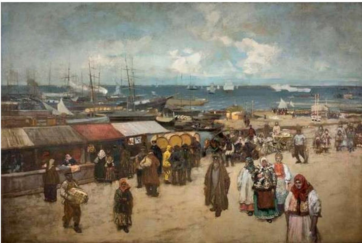
К.Коровин “Базар у пристани в Архангельске”

К.А.Коровин путешествует по Северу в период творческого кризиса. Вернувшись в Россию из Франции, где Константин Алексеевич провел 1892-1893 гг., художник был еще «весь полон искусством импрессионистов, поисками особой живописной красоты и правды образа»[3]. Париж не отвратил Коровина от России. Он скучал по ней. Возвращение на родину после долгого отсутствия придало особую прелесть и новизну всегда милым его сердцу образам. С большим трудом Константин Алексеевич освобождается от внешних заимствований. И помог мастеру в этом Север.