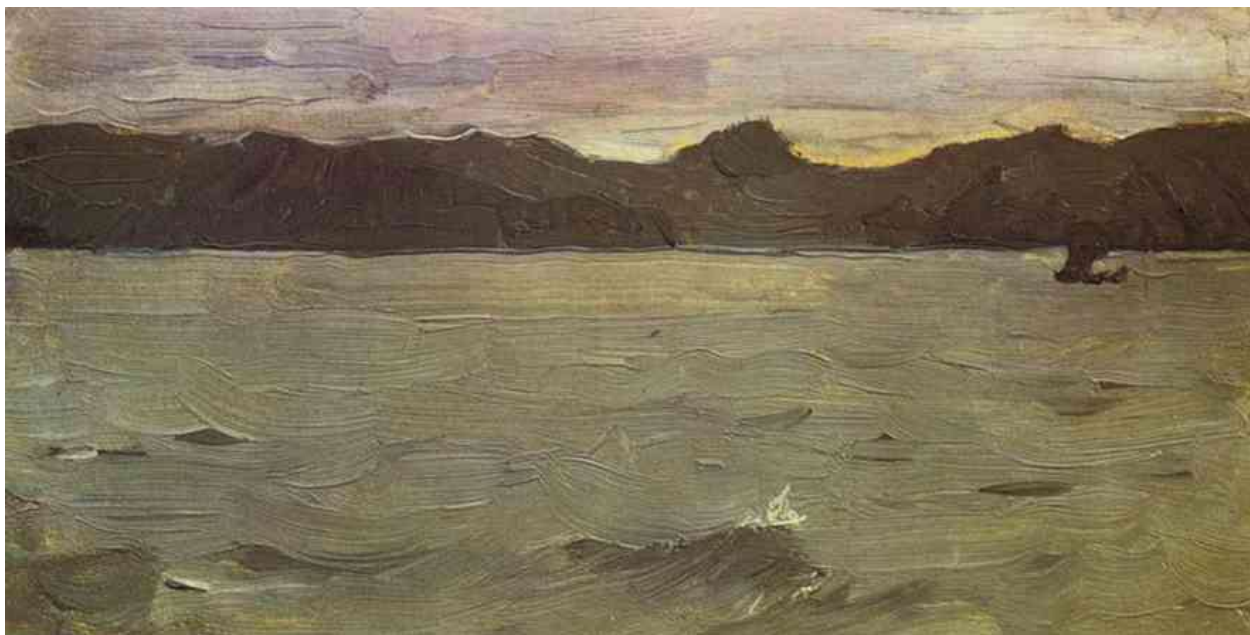
В.Серов “Белое море”

Из Архангельска художники на лучшем и самом комфортабельном в то время на Севере пароходе «Ломоносов», принадлежащем Товариществу «Архангельско-Мурманское срочное пароходство» отправились в путешествие по Белому морю. Намеревались посетить Соловецкие острова, но из-за плохой погоды, не заходя на Соловки, двинулись на север. Коровин вспоминает: «Я встаю и выхожу из каюты, ударяясь о стенки. По лестнице выбираюсь наверх. Волны с шумом бросают брызги на палубу. Пароход опускается вниз, и на него летят волны. Корма, у которой я стою, поднимается высоко. Я выбираю минуту и бегу в конец кормы, хватаюсь там за железное древко флага и вижу, как винты, вращаясь в воздухе, опускаются в темную воду. Корма ниже, ниже... Пароход как бы встал на дыбы... Но вот опять поднимается корма. По палубе бежит вода. Сбоку от меня, близко, на борт парохода села птица, зеленая, синяя. – свистнула громко. “Это буревестник”, – подумал я. Птица вспорхнула и пропала в волнах»[9].