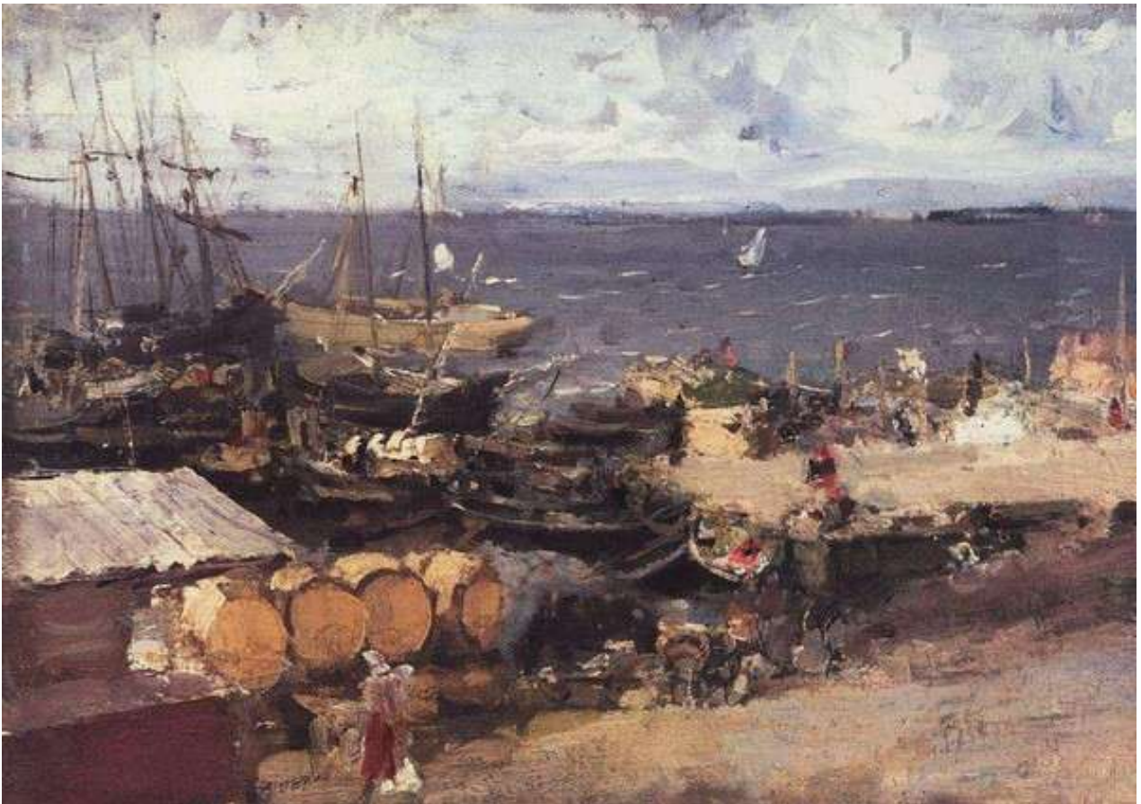
К.Коровин “Архангельский порт на Двине”