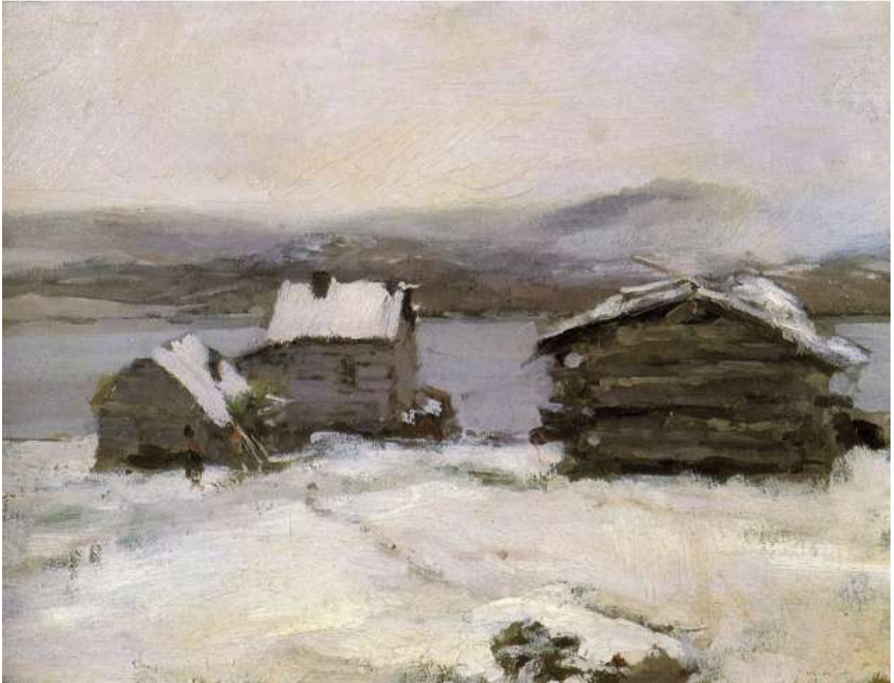
К.Коровин “Зима в Лапландии”

Посетил Коровин и поселения на пограничной с Норвегией реке Паз. Здесь написан один из лучших, на мой взгляд, его северных этюдов – « Церковь на Пазреке » (1894), запечатлевшая церковь Бориса и Глеба. Любовались оленьими стадами и наблюдали работу пастухов. В результате Коровин пишет этюд « Лапландский фильман – владелец оленьих стад » (1894).