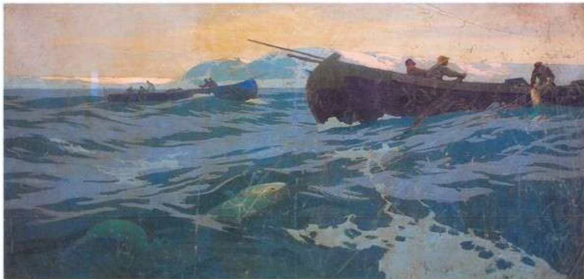
К.Коровин «Ловля рыбы на Мурманском море»

Пароход «Ломоносов» устремляется далее на запад и достигает одного из основных промысловых районов на мурманском берегу – становищ у реки Териберки, на острова Кильдин и в губах северо-западной части Кольского полуострова. Здесь Коровин пишет этюды «Становище Териберка на Мурмане», «Устье реки Териберки», «Треска и палтус», «Остров Кильдин», «Екатерининская гавань», «Церковь и кладбище в Еретиках», «Мурманский лов рыбы ярусами в море», «Берега Мурман (Поморские кресты)» (все – 1894 г.).