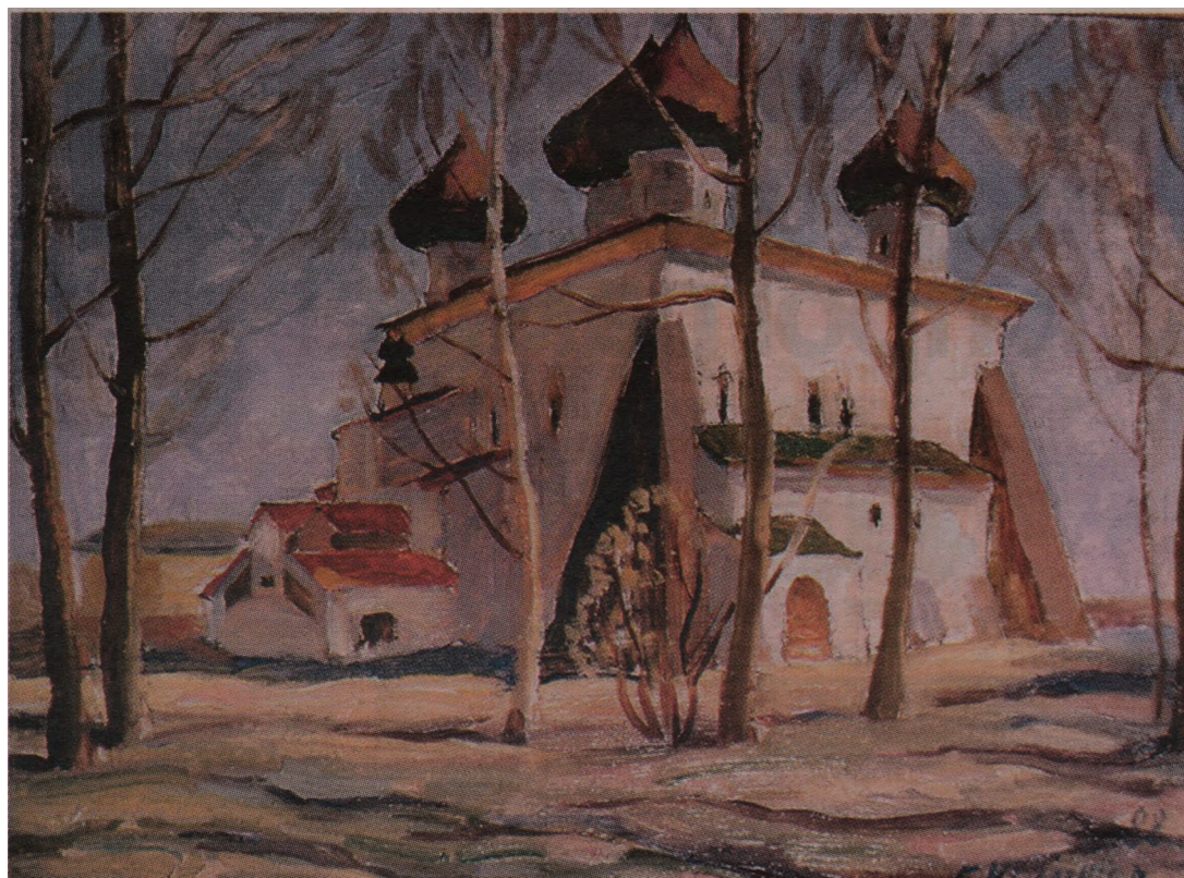
Весенний этиод, 1988