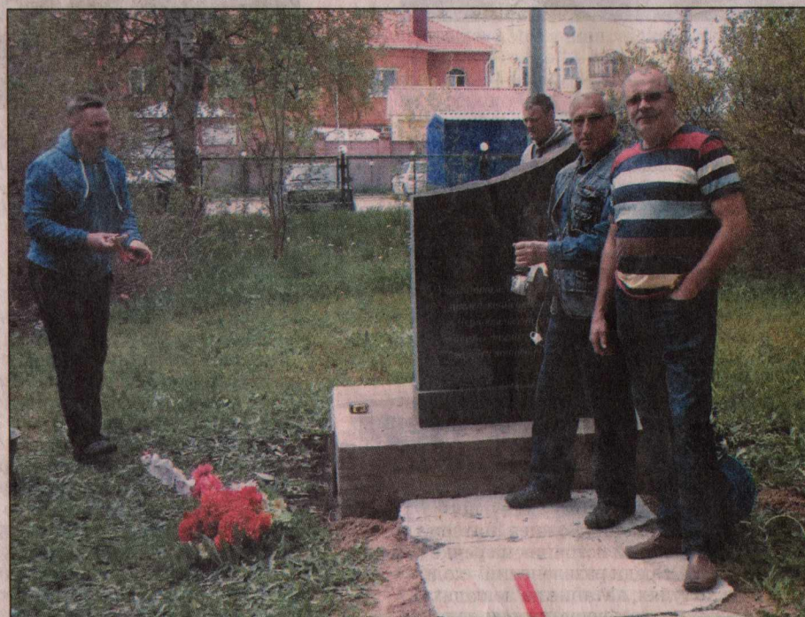
Котласские ликвидаторы на субботнике по благоустройству у памятника.