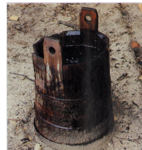
• Ведро — типичное для архангельской деревни.

В какой-то момент мне захотелось сильно ущипнуть себя, чтобы прервать этот странный сон. Что, собственно, торжественно