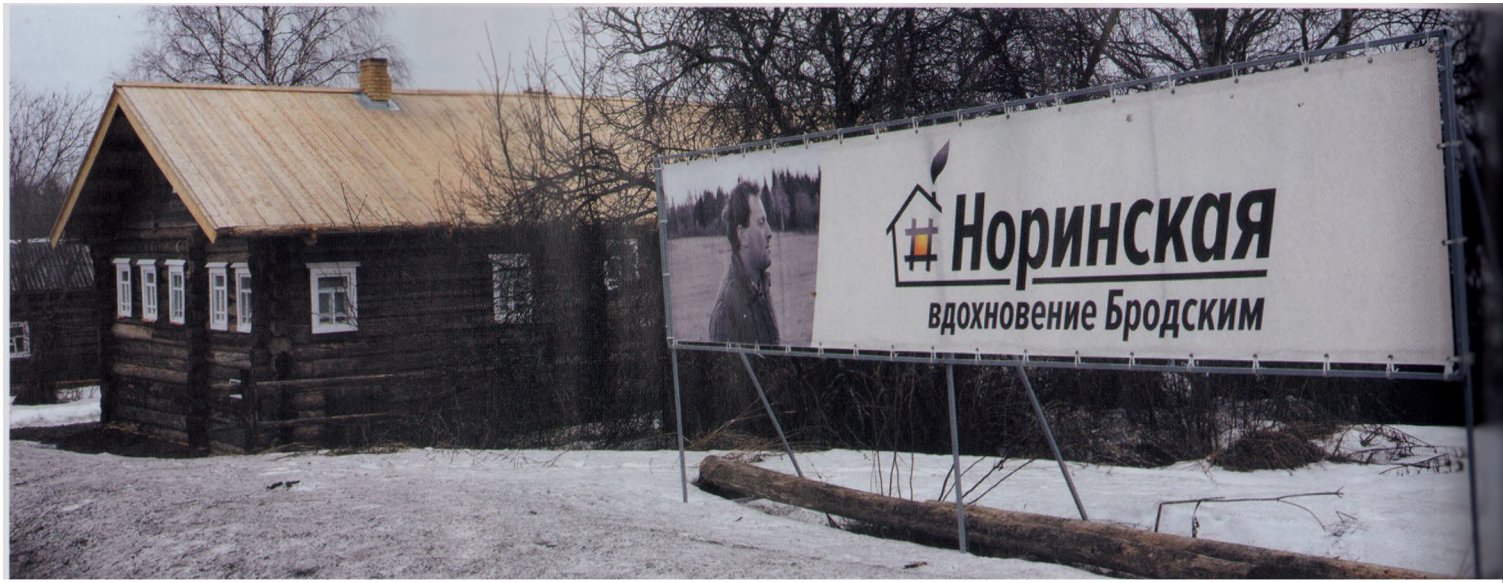
• Дом Пестеревых восстановили, а точнее — построили заново.