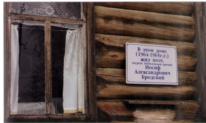
• Тут он жил недолго, недели две.

Так, за разговорами мы миновали старую почту, откуда Бродский звонил в Ленинград, и подошли к зданию районной библиотеки, носящей его имя. Тут, надо сказать, всё подчинено этому имени: и шкаф с книгами, которые он читал, и шкаф с книгами о нём, и портреты на стенах, и целая инсталляция, названная «По-