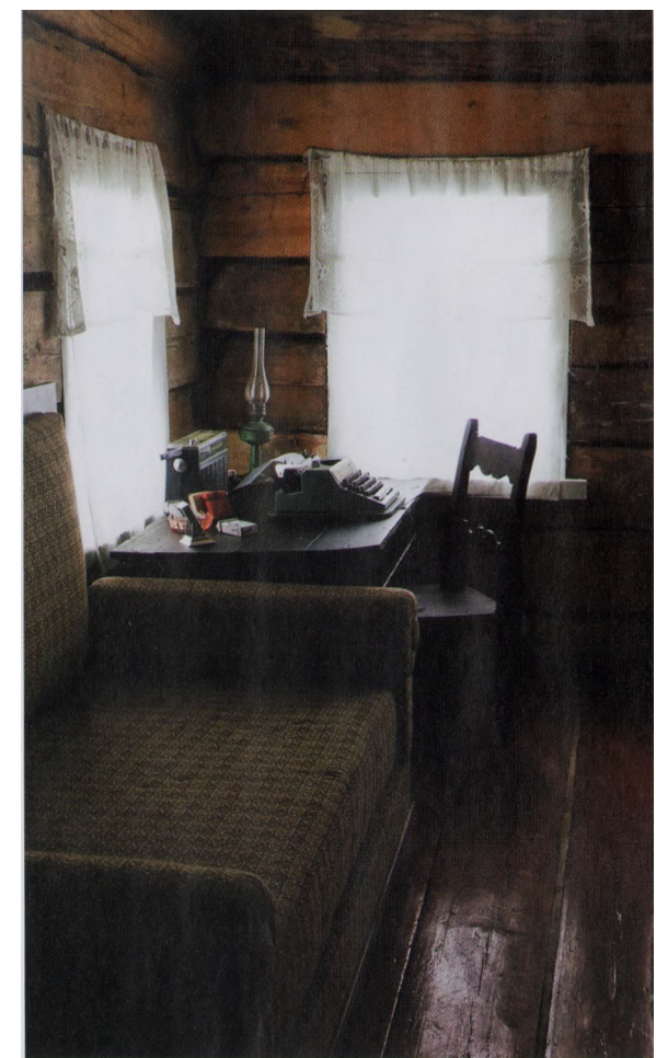
• Здесь он работал после работы.

Осматривая все это, я наткнулся на одну из многочисленных ссылок, выставленных здесь: «Иосиф Александрович вспоминал о Норинской: «Это был один из лучших периодов в моей жизни. Бывали и хуже, но лучше — пожалуй, не было». Всё, подумал я, пора выйти подышать свежим воз-