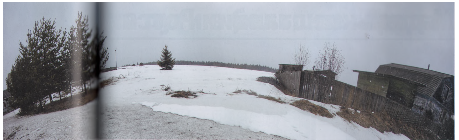
• Норенская умерла: ни хозяйств, ни крестьян.

Вот как было дело. Вот что неплохо бы помнить, не забывать. Иначе, не приведи господь, снова поедут в «отдаленные местности» туняедцы, без соответствующего образования возмнившие себя поэтами. Вот уже в разогретых политикой головах возникают инициативы о возвращении статьи «за туняедство» в нашу повседневную жизнь. Я рад бы ошибиться,