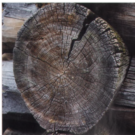
• Эти бревна проживут еще долго.

ТЕПЕРЬ ЖЕ Я ПОЗВОЛЮ СЕБЕ только напомнить то, что не следует забывать никогда и нигде, особенно в Коноше и Норенской.