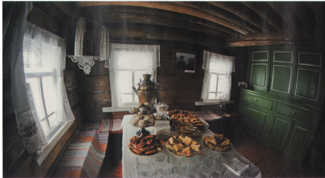
• Стол в избе накрыли, ждали губернатора.

и радостно мы здесь открываем, спросил я себя: дом, куда Бродский приезжал творить, уединившись от городской суеты или позорный для моего отечества факт ссылки большого поэта, его изощренное унижение ярлыком «туняедец», психушкой, несправедливым судом, тюремным заключением, принуждением к физическому труду, ограничением свободы? Что? И почему ни в библиотеке его имени, ни в доме-музее, ни в Норенской, ни в Коноше нет поразительных по степени хамства и невежества протоколов его допросов в Ленинградском суде?