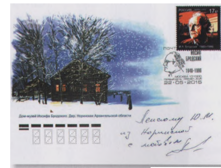
• Весточка из Норенской с маркой и спецгашением на конверте.

Бродский, словно предвидев всё, спустя десять лет после ссылки написал: «А зимой там колют дрова и сидят на репе, / и звезда моргает от дыма в морозном небе. / И не в ситцах в окне невеста, а праздник пыли / да пустое место, где мы любили».