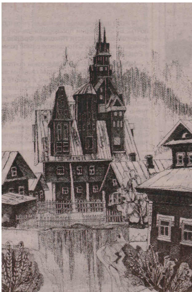
Дом Суягина, 1996