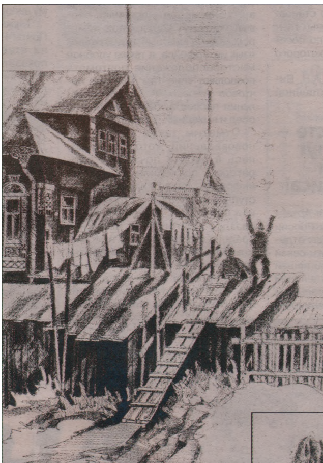
Дворик с голубятней, 1982