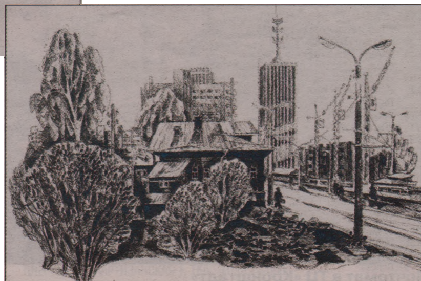
Улица Энгельса, 1980