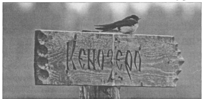
По дороге в рай..