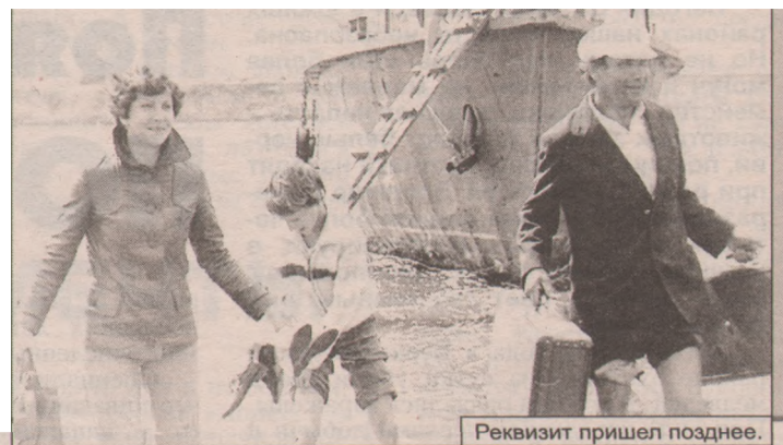
Реквизит пришел позднее.

На одном из гастрольных выступлений коллектива ДК в сельской местности произошел казус. Творческая группа путешествовала на машине, а реквизит и костюмы доставлялись на теплоходе. Как назло, утром необходимых атрибутов не привезли. Однако артисты не отказались от выступления. И дождавшись вечернего теплохода, на котором и были вещи, дали концерт. Дома они появились поздней ночью и долго объяснялись с домашними.