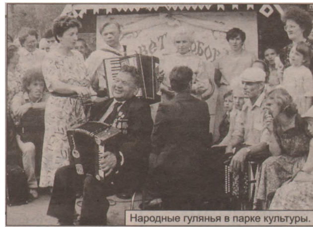
Народные гулянья в парке культуры.

На открытии первого международного фестиваля «Жемчужина Севера», состоявшегося на площади котлаского железнодорожного вокзала, произошло необычное явление. Когда выступали алеуты (народность Крайнего Севера, отличается своими музыкальными инструментами и оригинальной манерой пения), в воздухе появились чайки. Их число увеличивалось с каждой минутой, и скоро они заполнили собой все небо. Птицы, будто почувствовав северную морскую энергию алеутских мотивов, кричали в ответ музыке. Участники фестиваля были шокированы такой картиной.