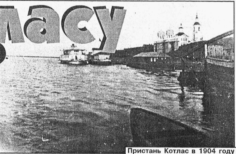
Пристань Котлас в 1904 году