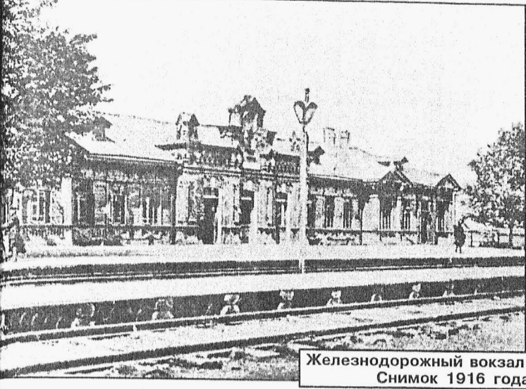
Железнодорожный вокзал. Снимок 1916 года