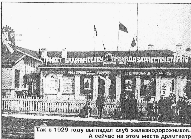
Так в 1929 году выглядел клуб железнодорожников. А сейчас на этом месте драмтеатр