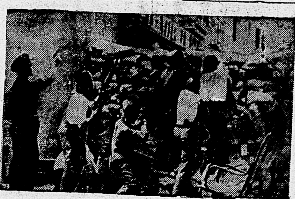
В ИСПАНИИ. НА СНИМКЕ: Отряд рабочей милиции стрелает из-за баррикады в мятежников, засевших в развалинах крепости Альказар.

ТОТЬМА, 26. В районе поселка Пиньга кружок юных натуралистов краеведов при неполной средней школе обнаружил залежи черного известняка. Образец находки, доставленный в музей им. А. В. Луначарского, направлен для исследования в Институт нефти.