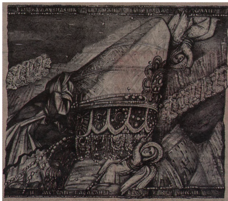
Серия «Встреча», 2000, автолитография