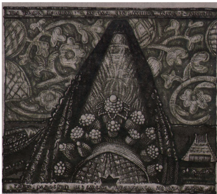
Серия «Встреча», 2000, автолитография