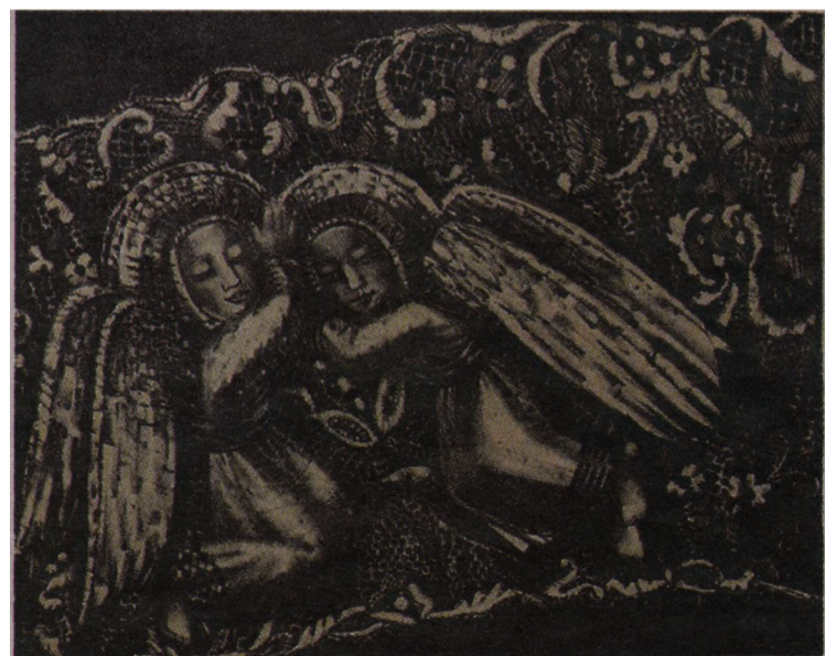
Серия «Забавы ангелов», «Сон», 2008, литография