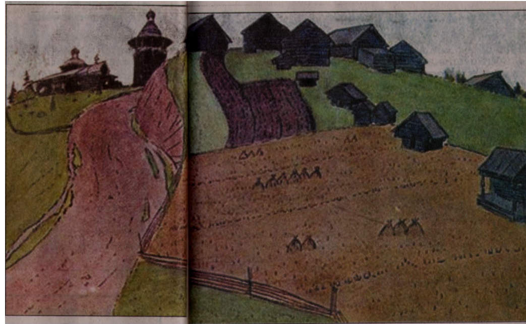
Игорь Грабарь. Погост в Сольвычегодском уезде.

На формирование и развитие сел и деревень Котласского района с середины XVII столетия огромную роль сыграли монастыри Устюжского и Усольского уездов (Михаило-Архангельский, Троице-Гледенский, Николаево-Придудский, Введенский, Николаево-Коряжемский), именитые купцы Строгановы. Вотчинные владения Великоустюжского Михаило-Архангельского монастыря на 1763 год в Устюжском и Усольском уездах (территория Котласского района),