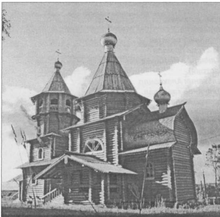
Церкви рубит предприятие «Деревянное зодчество»