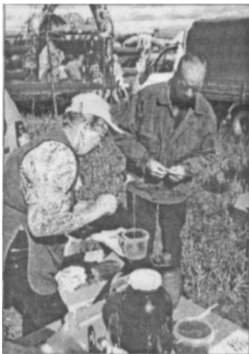
Ссыпчина медовая - любимый праздник устьяков