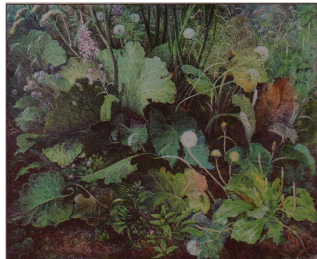
Воспоминание о лете