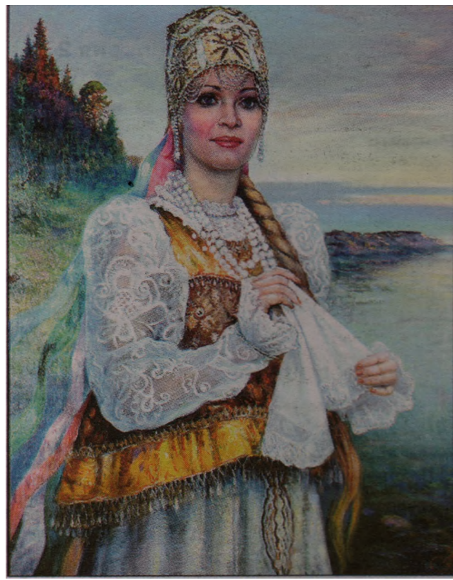
Солистка Северного хора