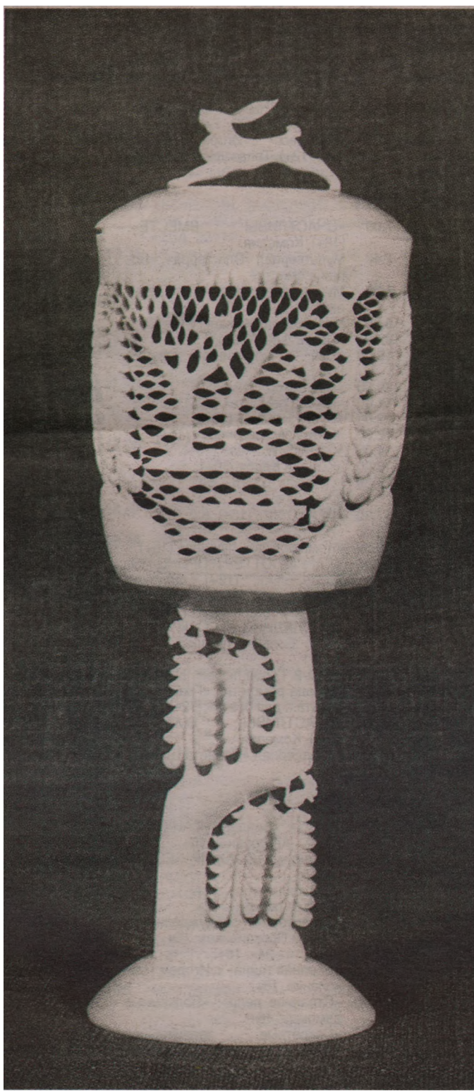
Ваза «Лесной мотив»