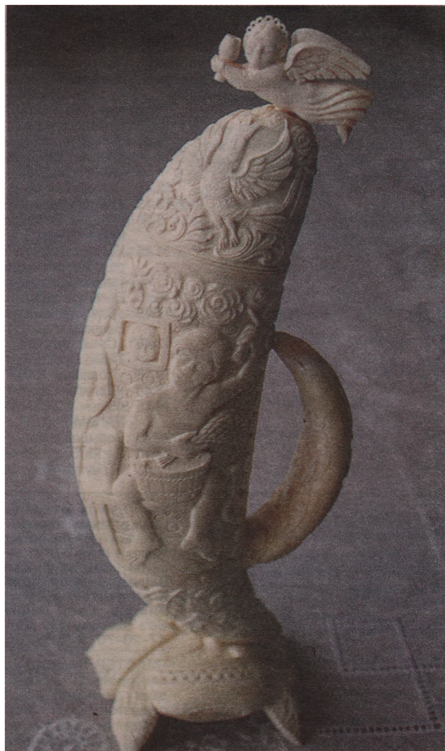
«Банька», зуб кашалота