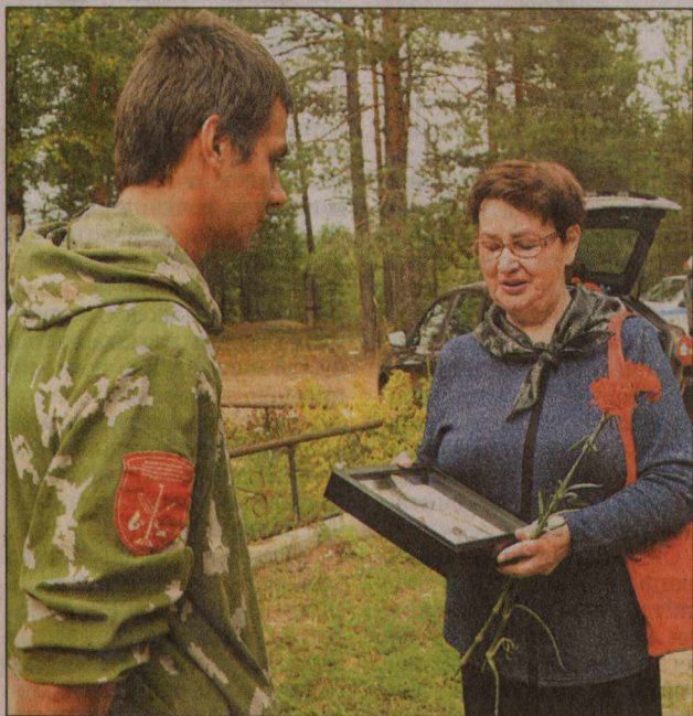
Поисковики передали родным солдата его личные вещи.

захоронен последний солдат. Сегодня день важный для нас всех, – поделился размышлениями главой города Андрей Бральнин.