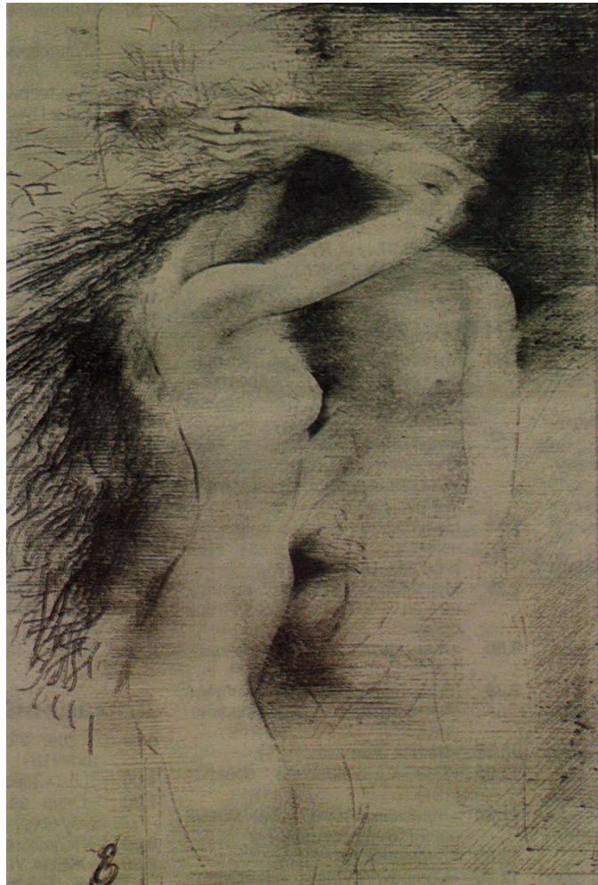
Маргарита у зеркала, иллюстрация к «Мастеру и Маргарите» Булгакова