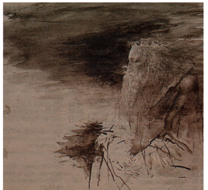
Король Лир - иллюстрация к Шекспиру