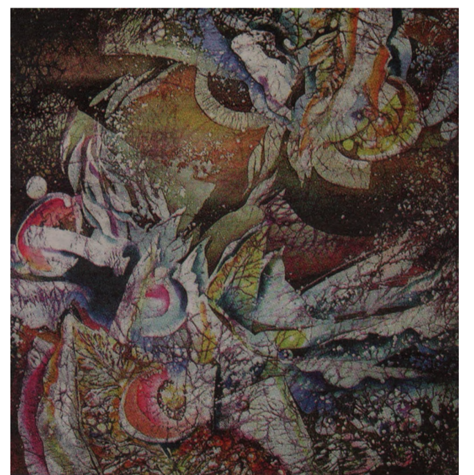
День листопада II