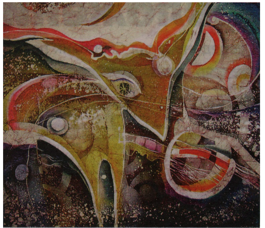
Сказки ночного неба. Лань