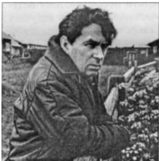
Фёдор Абрамов. Острота ума нелюдская была, Книжки писал, слово к слову приплетал круто и гораздо.

Отец Иоанн известен как величайший аскет и чудотворец, который лечил молитвою и возложением рук. Он занимался благотворительностью. Устроил в Кронштадте «Дом трудолюбия» со школой, церковью, мастерскими и приютом, основал в Суре женский монастырь и воздвиг храмы, а в Санкт-Петербурге построил женский монастырь на Карповке, где и был погребён. В 1990 году Иоанн Кронштадтский был канонизован.