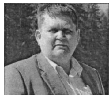
По мнению главы, активные общественники значительно улучшают быт деревни

Иоанно-Богословский Сурский монастырь был основан в селе Сура в 1899 году как женская монашеская община. 20 июня 1900 года состоялось его торжественное освящение, а в ноябре вместо общины был учреждён Иоанно-Богословский женский монастырь.