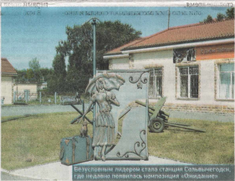
Безусловным лидером стала станция Сольвычегодск, где недавно появилась композиция «Ожидание»

гиона, где заботятся о комфорте и эстетичности, занимаются благоустройством, сажают деревья, выращивают цветы, — подчеркнул заместитель начальника Сольвычегодского центра