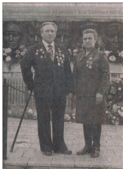
У обелиска в деревне Федотовской. 1980 год.