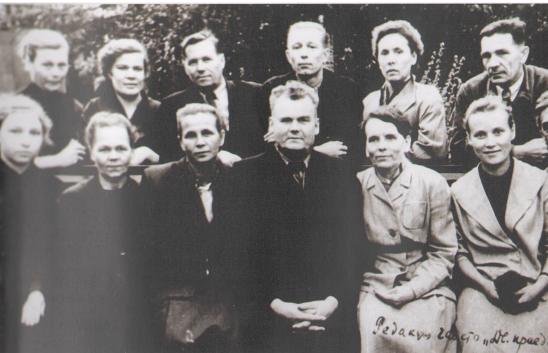
Коллектив редакции газеты «Двинская правда», 1954 г.