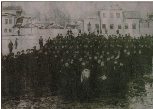
4-й экспедиционный отряд моряков Балтийского флота. Велкий Устюг. 1918 год.

как не сказал им, какой груз они должны доставить в Вологду, но в то же время понимал: никому нельзя говорить о таких деньгах. Потянулись дни ожидания, полные тревог и волнений.