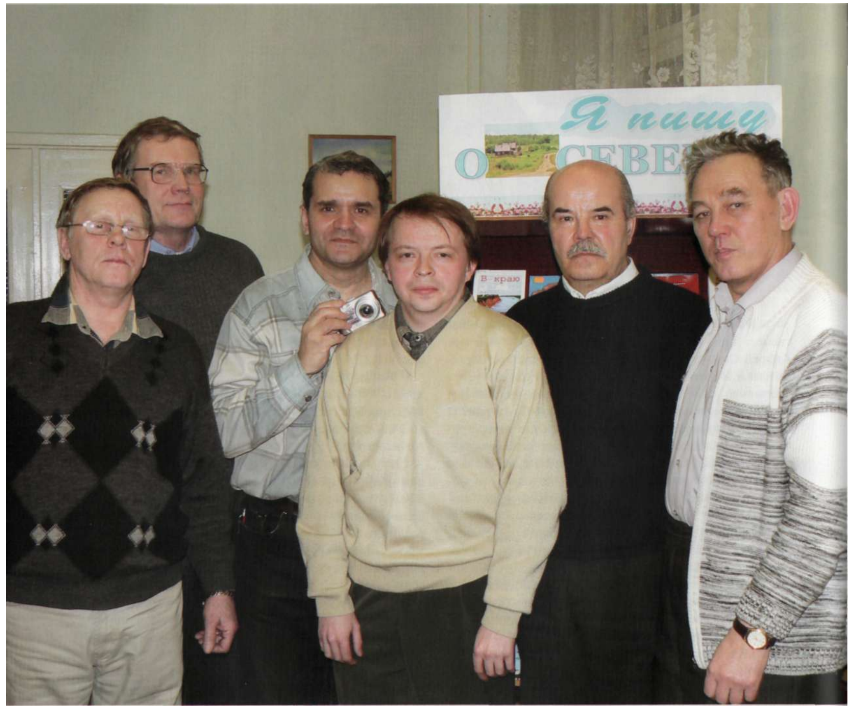
Котласское братство авторов