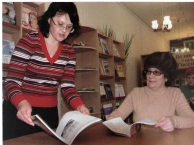
В читальном зале центральной городской библиотеки

ЦБС обслуживает около 23 000 читателей. Книжный фонд составляет 337450 экземпляров. Оформлена подписка на 107 журналов и 24 газеты. В библиотеках налажено информационное обслуживание специалистов, выполняются разнообразные запросы читателей. Работает Центр правовой информации. Оказывается консультативная помощь, проводятся семинары и тренинги. В центральной городской библиотеке специалисты ведут электронный каталог и три собственных базы данных. Реализация проекта «Информатизация Котласской централизованной библиотечной системы» позволила выйти на современный уровень