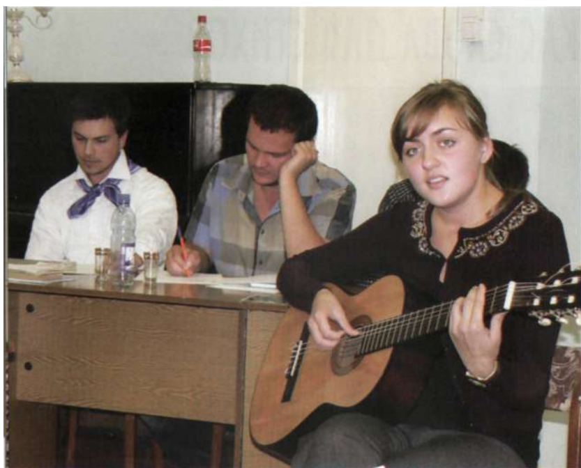
Поэтическая дуэль начинающих котласских авторов