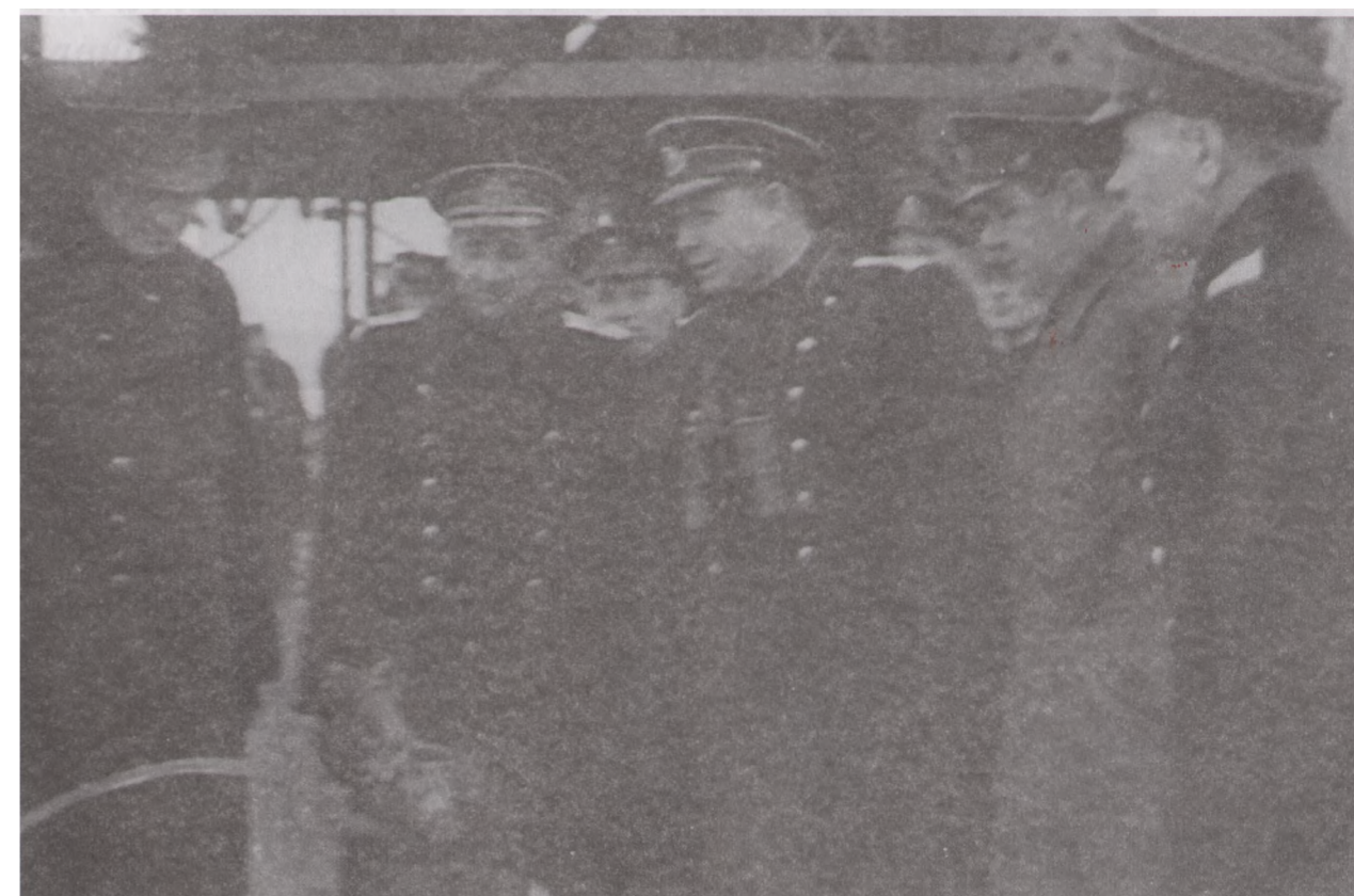
Среди военморев на корабле, 1943 год.