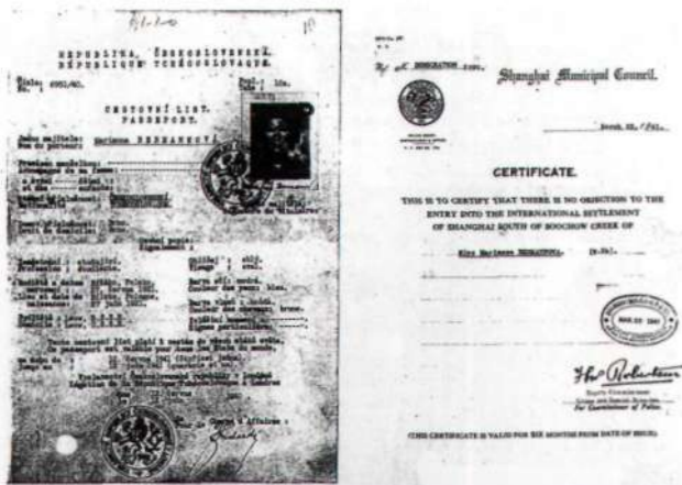
Паспорт дочери польского осадника.