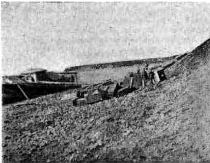
Рис. 4. Погрузка ящиков с коллекциями на баржу экспедицией 1923 г.

На месте раскопок остались лишь крыша сарая, в котором помещались коллекции — в виде навеса на столбах и другой маленький бревенчатый весьма ветхий сарай, который в свое время, при работах проф. Амалицкого, служил ему рабочим павильоном.