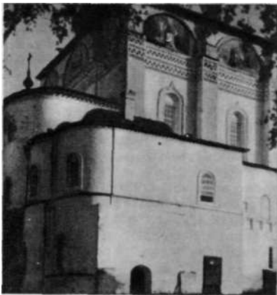
Благовещенский собор в Сольвычегодске. 1560—1579