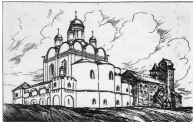
Благовещенский собор и палаты Строгановых Реконструкция автора