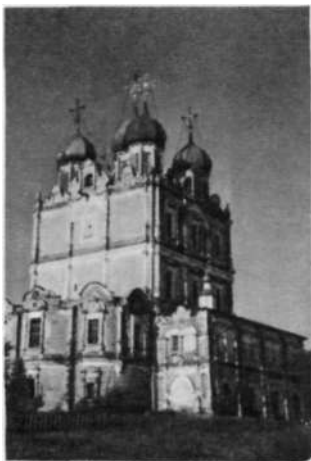
Собор Введенского монастыря в Сольвычегдске. 1689 — 1693

женный богатым, исключительно сложным и разнообразным белокаменным декором, наложенным на нежно-розовый фон кирпичной стены. Формы этого декора имеют очень мало общего со всей предшествующей русской архитектурой. Здесь преобладают мотивы западноевропейского, и прежде всего голландского, барокко. Впрочем, напрасно было бы размышлять о возможном участии в строительстве собора зодчего-голландца, хотя такая легенда и существует. В конце XVII века никто в Голландии уже не украшал фасады вычурной барочной резьбой. Зато русские купцы, ездившие в Голландию, могли видеть красивые старые ратуши с затейливыми наличниками окон на красном фоне кирпичных стен, да и в самой России ходило Немало гравированных увражей, в изобилии доставлявших резчикам и зодчим орнаментальные и архитектурные мотивы. Пышная декорация, подобная той, которая украшает стены сольвычегдского собора, тогда же начала входить в моду в