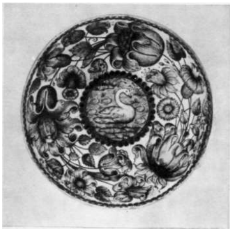
Чаша усольской эмали из коллекции Государственного Исторического музея. XVII век

тое время сольвычегодская финифть по технике и манере исполнения мало чем отличалась от устюжской: в скани выполнялся контурный рисунок — стилизованный растительный орнамент, а промежутки заполнялись цветной эмалевой массой. Только в последней четверти XVII века появляется в Сольвычегодске живописная эмаль, сразу выдвинувшая строгановские мастерские на первое место в русском финифтяном деле. Произведения сольвычегодских эмальеров конца XVII века имеют свой, очень четко выраженный художественный почерк. На снежно-белом фоне размещаются крупные изображения цветов — мака, подсолнуха, тюльпанов, выполненные в реалистической манере яркими желтыми, синеголубыми и зелеными красками. В середине часто помещаются клейма с сюжетными изображениями — зверями, птицами, юношами и девушками, библейскими сценами, аллегориями. Сюжеты заимствованы из привозных западноевропейских гравюр — «фряжских листов»