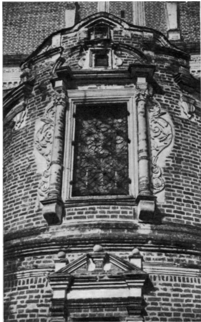
Собор Введенского монастыря. Алтарное окно

женный богатым, исключительно сложным и разнообразным белокаменным декором, наложенным на нежно-розовый фон кирпичной стены. Формы этого декора имеют очень мало общего со всей предшествующей русской архитектурой. Здесь преобладают мотивы западноевропейского, и прежде всего голландского, барокко. Впрочем, напрасно было бы размышлять о возможном участии в строительстве собора зодчего-голландца, хотя такая легенда и существует. В конце XVII века никто в Голландии уже не украшал фасады вычурной барочной резьбой. Зато русские купцы, ездившие в Голландию, могли видеть красивые старые ратуши с затейливыми наличниками окон на красном фоне кирпичных стен, да и в самой России ходило Немало гравированных увражей, в изобилии доставлявших резчикам и зодчим орнаментальные и архитектурные мотивы. Пышная декорация, подобная той, которая украшает стены сольвычегдского собора, тогда же начала входить в моду в