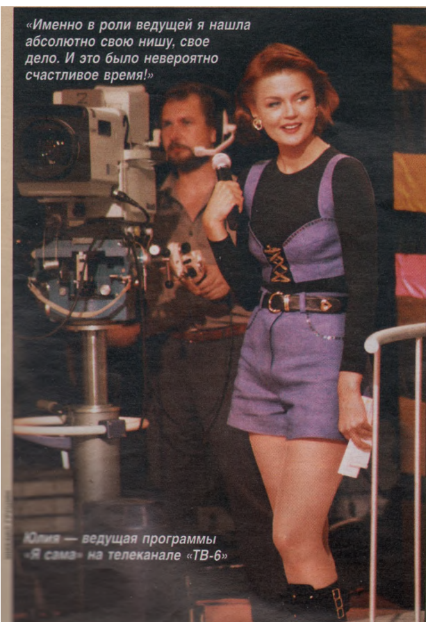
«Именно в роли ведущей я нашла абсолютно свою нишу, свое дело. И это было невероятно счастливым временем!»

— Конечно нет. Да и никто тогда не осознавал, что снимается картина, которая обретет такую народную любовь. Я просто проводила часть каникул с папой. Но, кстати, там впервые ощутила себя совсем взрослой, помогая ему по быту. Мы жили в гостиничном номере, и я папе стирала и гладила рубашки. Именно на этих